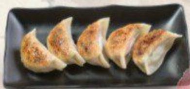
餃子 Pork Gyoza $4.90 (5pcs) $9.00 (10pcs)