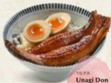
うなぎ丼 Unagi Don $16.90