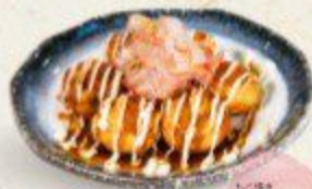
太く焼き Tako Yaki $5.90