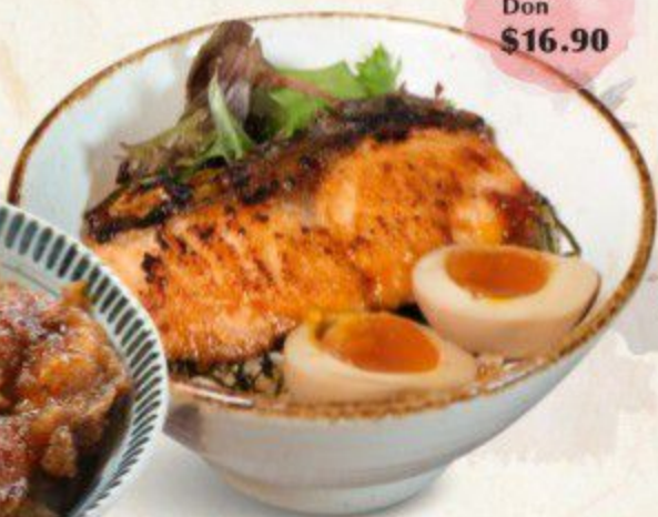
鮭丼 Salmon Don $16.90