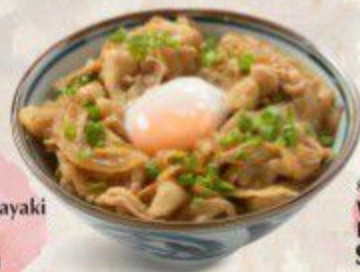
豚生姜焼き丼 Buta Shogayaki Don $11.90