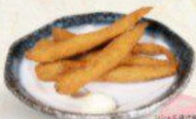
シシモ揚げ Shishamo Fry $6.90