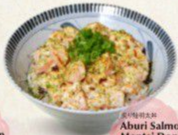
炙り鮭明太子丼 Aburi Salmon Mentai Don $11.90