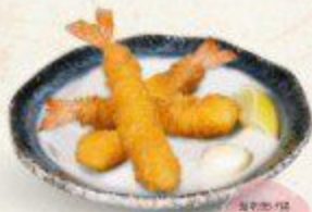
塩辛揚げ Ebi Fry $4.90