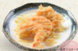
塩辛マヨネーズ Prawn Mayonnaise $6.90