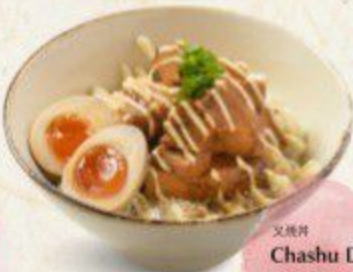
叉焼丼 Chashu Don $10.90