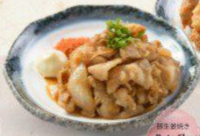
豚生姜焼き Buta Shogayaki $6.90