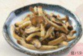
紐バタ一焼き Kinoko Butter Yaki $6.90