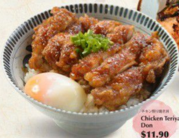
チキン照り焼き丼 Chicken Teriyaki Don $11.90