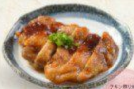
チキン照り焼き Chicken Teriyaki $8.90