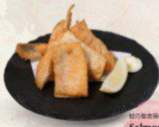
鮭の腹巻揚げ Salmon Belly Karaage $8.90