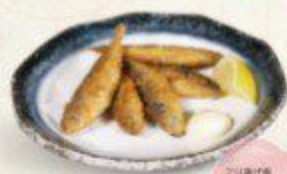
アジ揚げ Aji Karaage $6.90