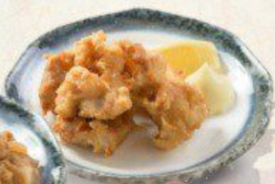
鶏のから揚げ Tori Karaage $4.90