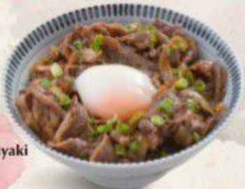
和牛すき焼き丼 Wagyu Sukiyaki Don $16.90