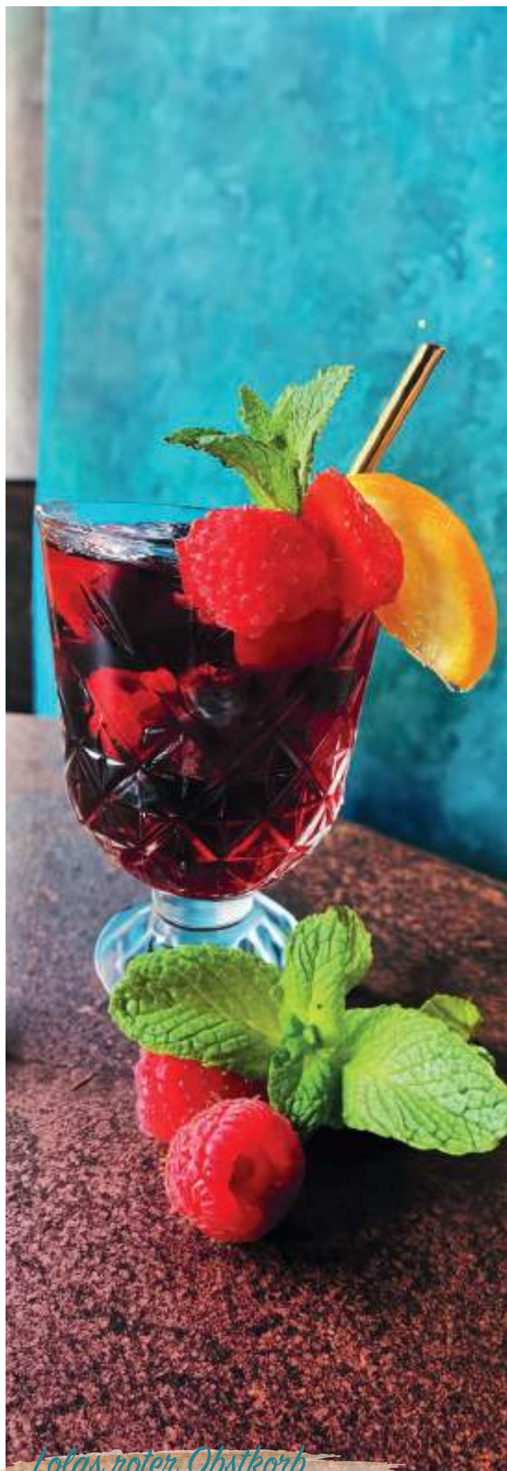
Lolas roter Obstkorb