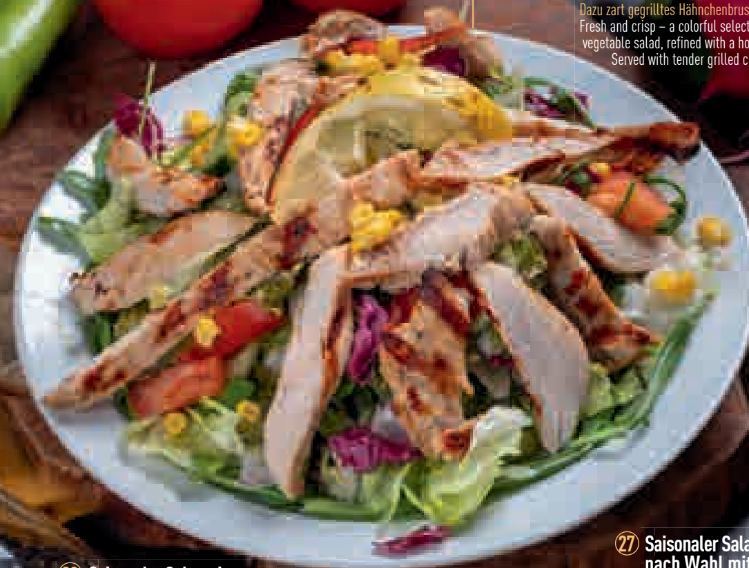
26 Saisonaler Salat mit gegrilltem Hähnchenbrustfilet 18,90€ Frisch und knackig – eine bunte Auswahl an saisonalem Blatt- und Gemüsesalat, verfeinert mit einem hausgemachten Dressing. Dazu zart gegrilltes Hähnchenbrustfilet. Fresh and crisp – a colorful selection of seasonal leaf and vegetable salad, refined with a homemade dressing. Served with tender grilled chicken breast fillet.

Frisch und knackig – eine bunte Auswahl saisonaler Blattsalate, verfeinert mit aromatischem weißem Käse, dazu Tomaten, Gurken und ein hausgemachtes Dressing. Fresh and crisp – a colorful selection of seasonal leaf salads, refined with aromatic white cheese, accompanied by tomatoes, cucumbers, and a homemade dressing.