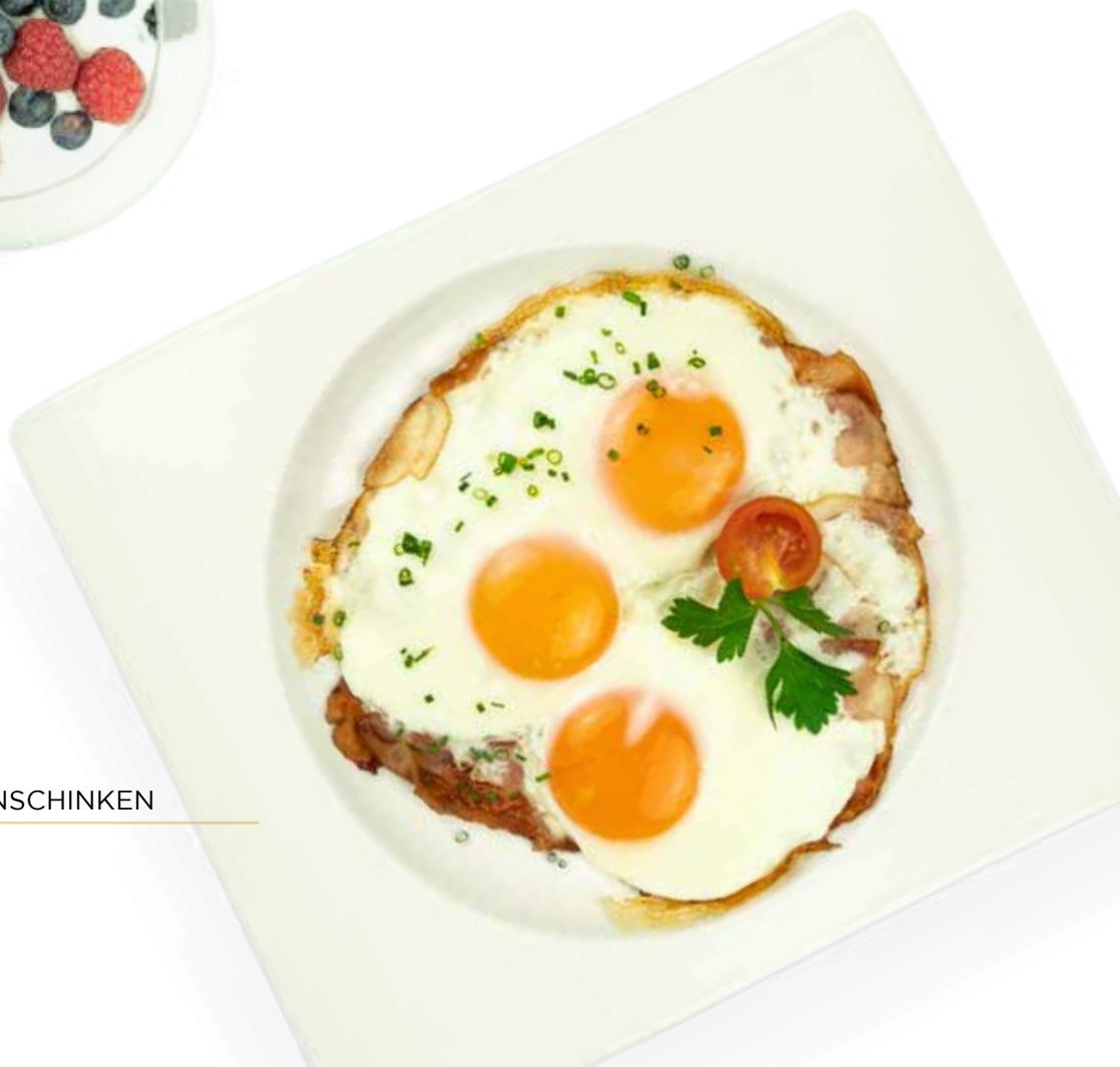
OMELETTE MIT PUTENSCHINKEN