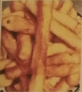
BOCCONCINI DEL DIAVOLO