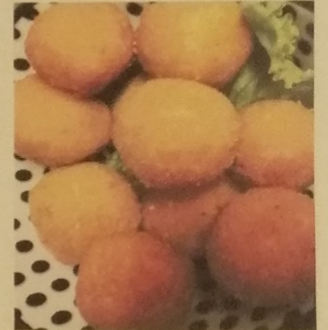
COCCOLI AL ROSMARINO

salsiccine con pomodoro, peperoncino e paprika