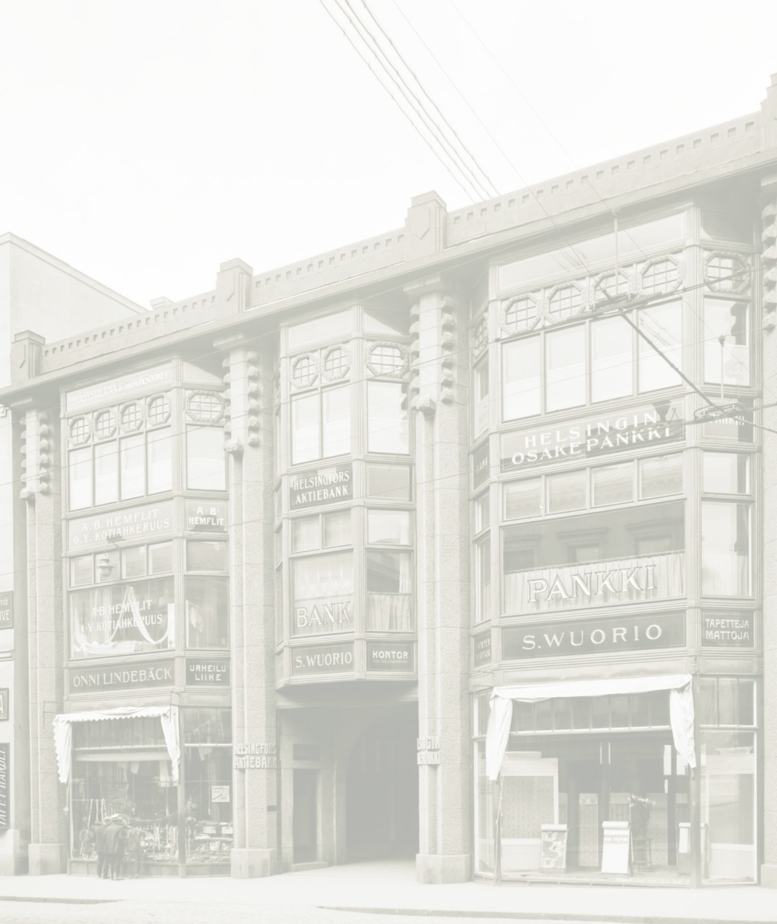
Unioninkatu 30, year 1913, Sundström Eric