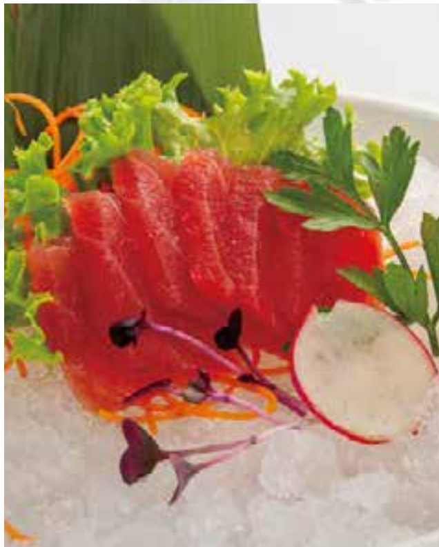
95. SASHIMI DI TONNO (6PZ)