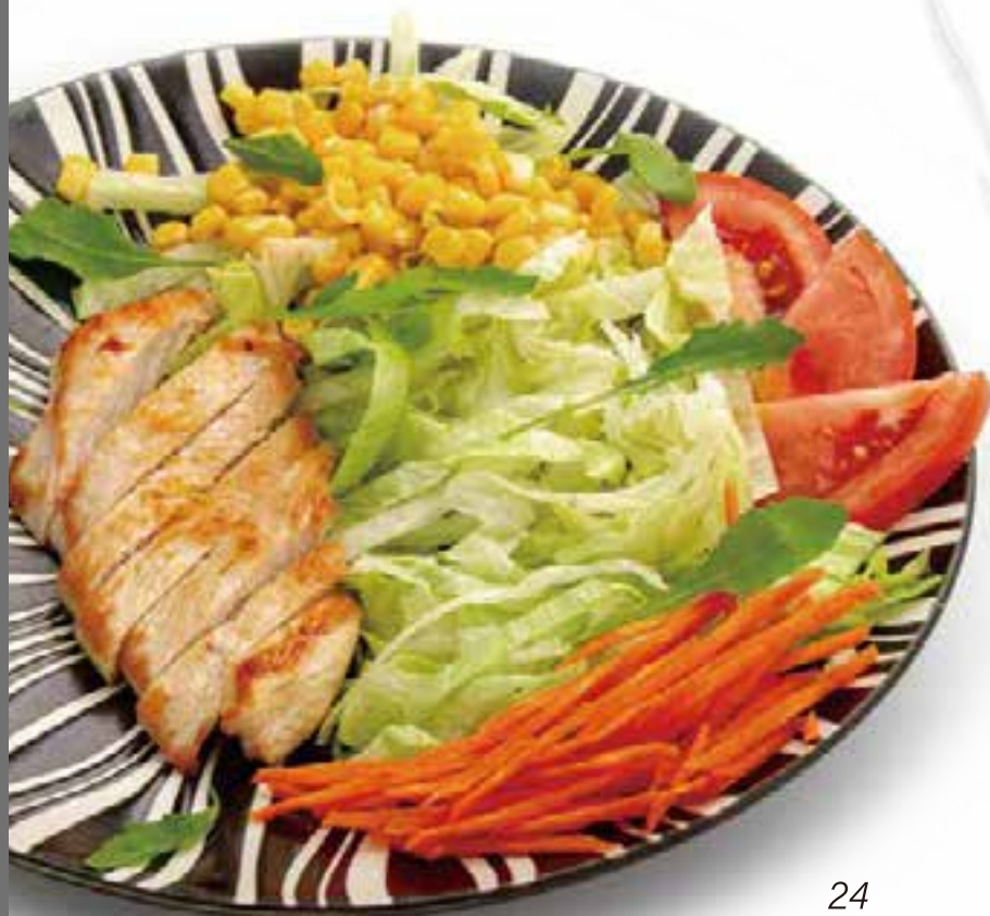
24. INSALATA DI POLLO