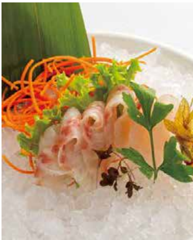
96. SASHIMI DI PESCE BIANCO (6PZ)