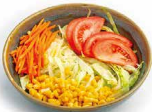
22. INSALATA MISTA