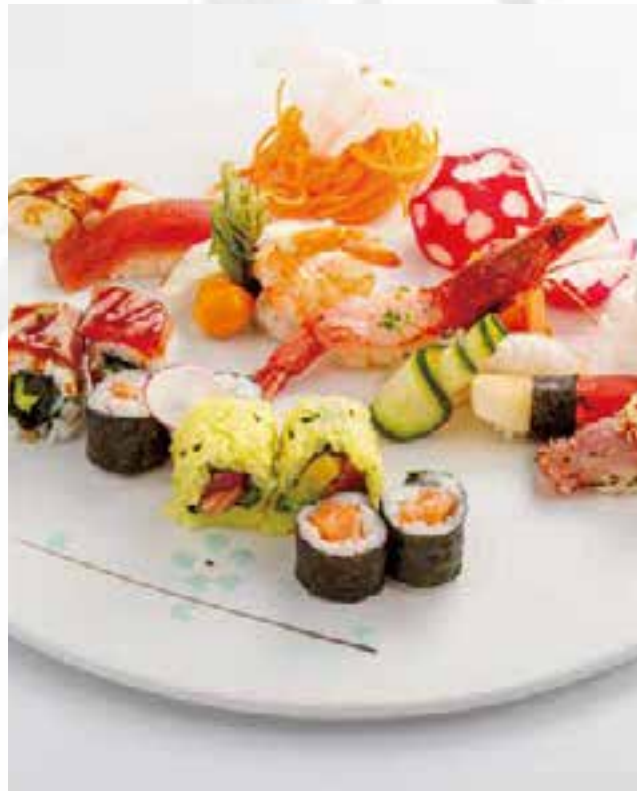
103. SUSHI MISTO (15PZ)

6 nigiri, 6 sashimi, 4 uramaki, 4 hosomaki 16,00 €