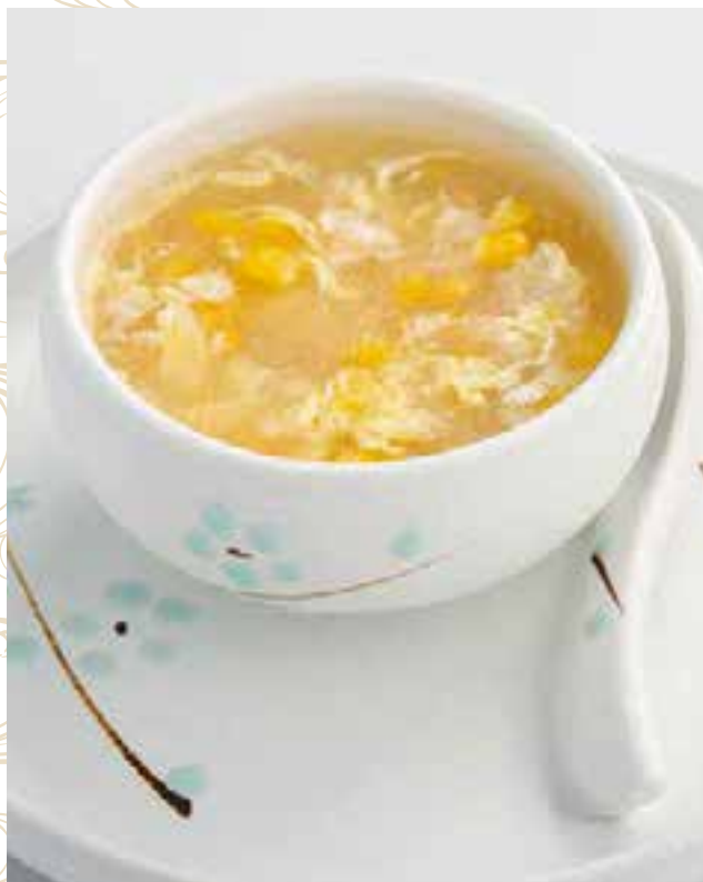
21. ZUPPA POLLO E MAIS