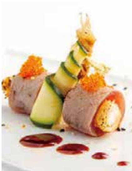
131. GUNKAN TONNO ROLL 2PZ

bocconcini di gamberi fritti e insalata, avvolti con tonno scottato e salsa yuzu miso 6,00 €