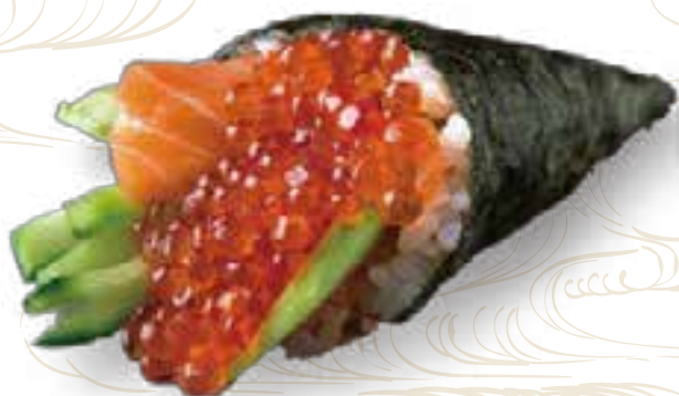
135. SALMONE, AVOCADO E MAIONESE