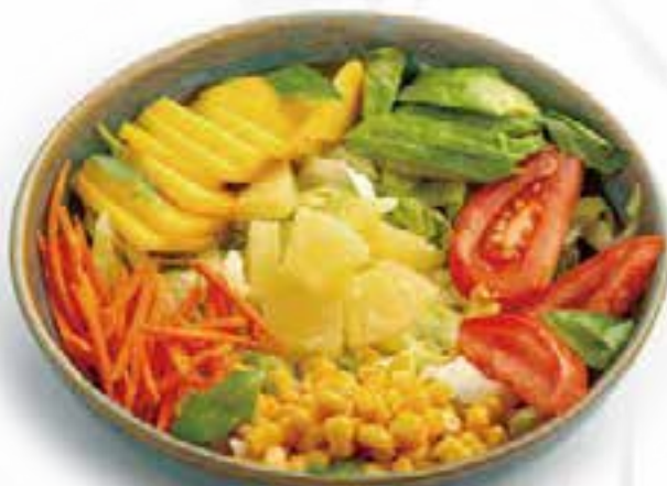
23. INSALATA TROPICALE