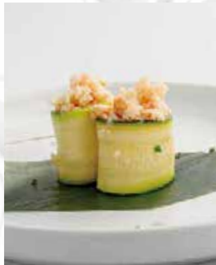
127. GUNKAN ZUCCHINE 2PZ

bocconcini di riso avvolti con zucchini, guarniti con tartare di gamberetti, surimi*, maionese e tobiko*