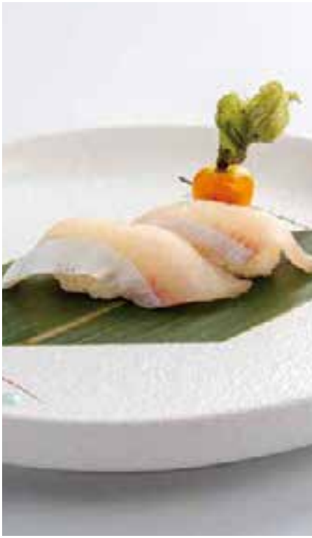
111. NIGIRI RICCIOLA