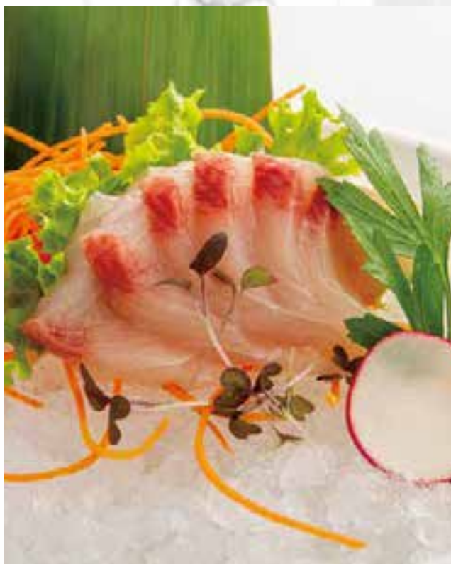
97. SASHIMI DI RICCIOLA (6PZ)