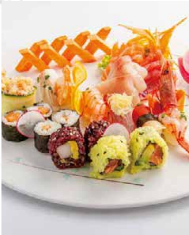
102. SUSHI SASHIMI MISTO (20PZ)

6 nigiri, 6 sashimi, 4 uramaki, 4 hosomaki 16,00 €