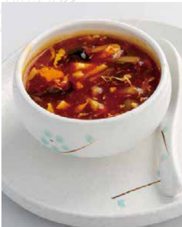
20. ZUPPA AGROPICCANTE