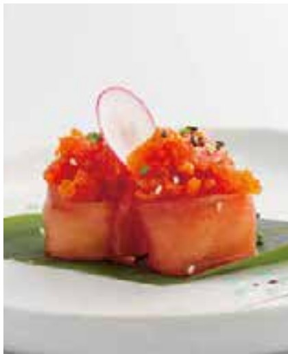
126. GUNKAN SPICY MAGURO 2PZ

bocconcini di riso avvolti con tonno, guarniti con tartare salmone, tobiko* e salsa piccante