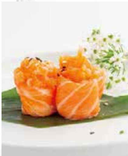
125. GUNKAN SPICY SALMONE 2PZ

bocconcini di riso avvolti con salmone, guarniti con tartare salmone, tobiko* e salsa piccante