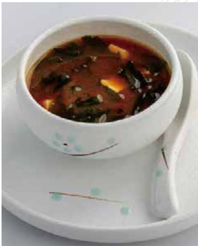
18. ZUPPA MISO