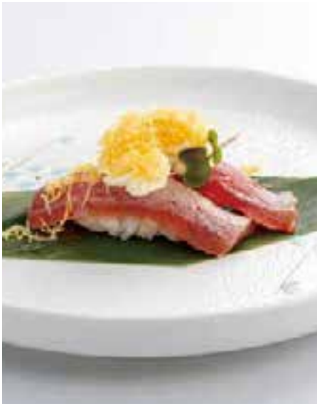
114. TONNO FLY