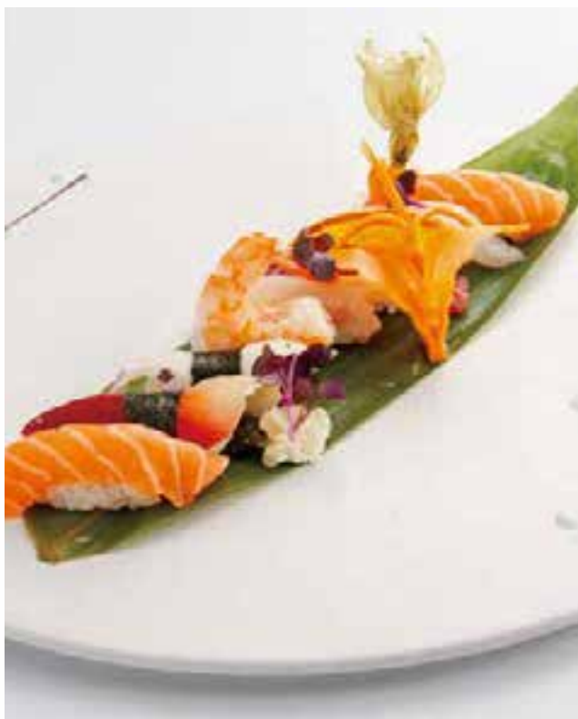
104. NIGIRI MISTI (8PZ)

9 nigiri, 6 misti di uramaki e hosomaki 13,00 €