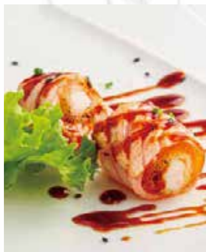
130. GUNKAN SALMONE ROLL 2PZ

bocconcini di gamberi fritti e insalata, avvolti con salmone scottato e salsa yuzu miso