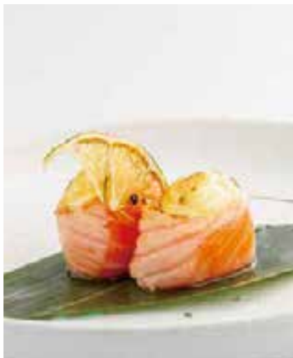
128. GUNKAN FLAMBÈ 2PZ

bocconcini di riso avvolti con salmone, guarniti con crema di latte