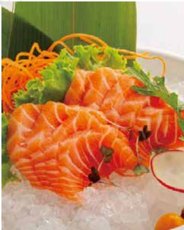
94. SASHIMI DI SALMONE (9PZ)