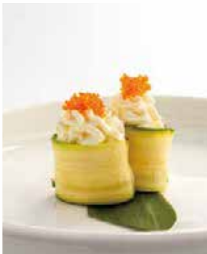
129. GUNKAN PHILADELPHIA 2PZ

bocconcini di riso avvolti con zucchini, guarniti con philadelphia e tobiko*