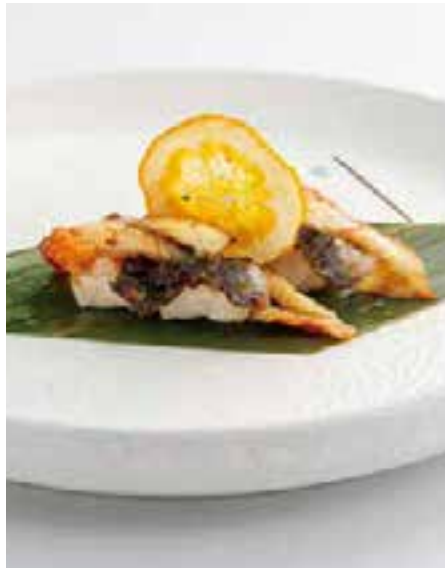
115. UNAGHI (ANGUILLA)