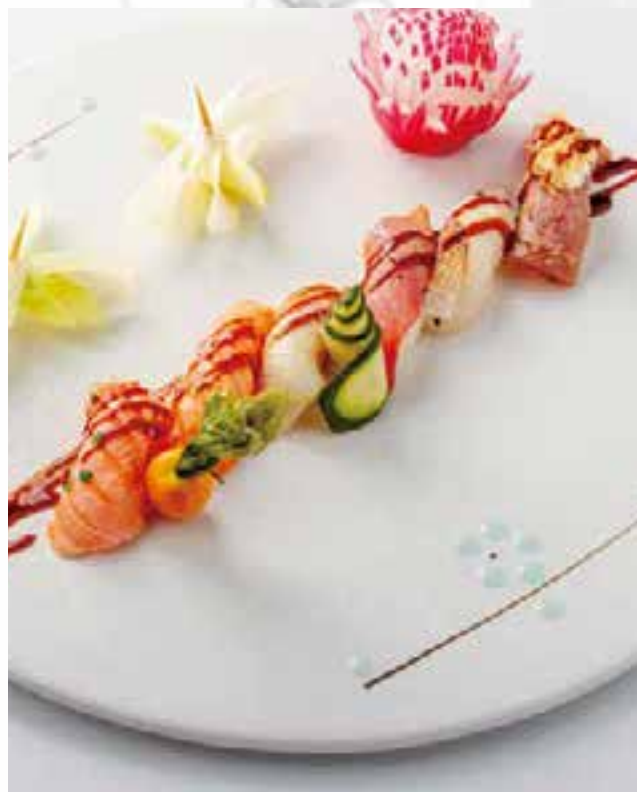
105. NIGIRI MISTI SCOTTATTO (8PZ)