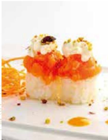
132. TEMARIZUSHI SAKE 2PZ

bocconcini di gamberi fritti e insalata, avvolti con tonno scottato e salsa yuzu miso 6,00 €