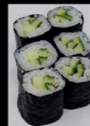
11. Kappa Maki