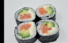
205. Philly Roll