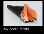
442. Shake Temaki