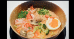
NU.2 Cream Ramen