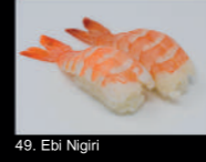
49. Ebi Nigiri