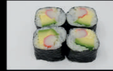
200. California Roll