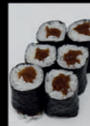
16. Kanpyou Maki