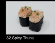
82. Spicy Thuna