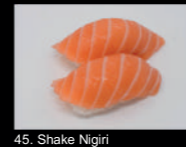
45. Shake Nigiri