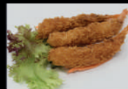
97. Ebi Fried

91. Seetang Salat 3,00€ 92. Spinat Salat B 3,00€ 93. Kimchi Salat 1 3,00€ 94. Edamame (Sojabohnen) 3,20€ 95. Frühlingsrollen (je 4 Stück) 3,10€ 96. Tori Karaage c (je 3 Stück) 3,00€ 97. Ebi Fried B (je 3 Stück) 3,20€ 98. Vegetarische Gyoza (je 3 Stück) 3,10€ 99. Kartoffel Garnelen B (je 3 Stück) 3,20€ 100. Yakitori (je 3 Stück) 3,50€ 101. Checken Teriyaki 4,50€ 102. Maki Tempura (4 Stück) A-B 3,90€ 103. Miso Suppe 3,00€ 104. Hähnchen Gyoza (je 3 Stück) 3,90€ 105. Ebi Shao (je 4 Stück) 3,90€