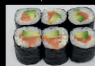
25. Shake Avocado Maki