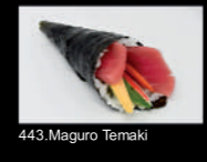
443. Maguro Temaki