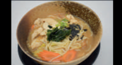
NU.1 Miso Ramen