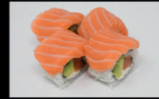
209. Shake Rainbow

80. Wakame Gunkan 1 3,50€ 81. Spicy Salmon D-c-□ 3,50€ 82. Spicy Thuna D-c-□ 3,50€ 83. Lachstartar □-D-K 4,00€ 84. Kan Gunkan D-c-B 4,00€ 85. Thunfischfatar □-D-K 4,50€ 86. Tobiko Gunkan D 6,00€