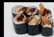
29. Ebi Tempura Maki