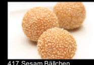
417. Sesam Bällchen