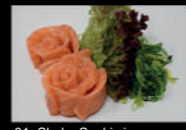
01. Shake Sashimi

6 Inside out Roll 5 Lachstartar 4 Shake Maki 4 Tekka Maki