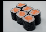
24. Shake Maki