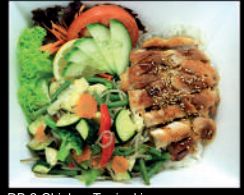
DB.2 Chicken Teriyaki

DB.1 Salomon Teriyaki 1.-D 9,90€ Lachsfilet Gebraten mit Teriyaki Soße DB.2 Chicken Teriyaki 1- 9,20€ Panierte Hähnchen Keule mit Teriyaki Soße DB3. Chicken Katsu Curry 1- 9,20€ Panierte Hähnchen Keule mit Katsu Curry Soße DB.4 Ebi Fried Katsu Curry 1.-B 9,90€ Panierte Garnelen mit Katsu Curry Soße DB.5 Ebi Chili 1.-B 9,90€ Panierte Garnelen mit Chili Soße DB.6 Yaki Niku 1- 9,90€ Rindfleischstreifen mit Niku Soße DB.7 Kamo Yaki 1- 9,90€ Ente mit Teriyaki Soße