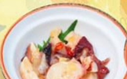
39. 大きなたこわさび Hokkaido Tako Wasabi $8.0