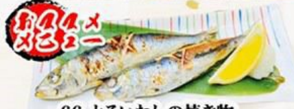
66. とろいわしの焼き物 Grilled Toroiwashi $12.0