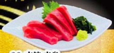
26. 本鮪 赤身 $16.8 Hon Maguro Akami