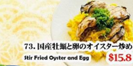
73. 国産牡蠣と卵のオイスター炒め Stir Fried Oyster and Egg $15.8