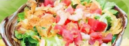
52. いつもの海鮮サラダ Seafood Salad $12.8