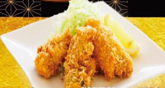
58. 国産牡蠣のカキフライ Fried Oyster $14.8