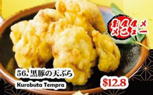
56. 黒豚の天ぷら Kurobuta Tempura $12.8