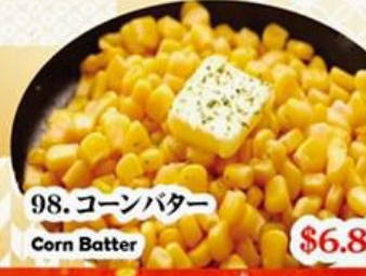
98. コーンバター Corn Batter $6.8