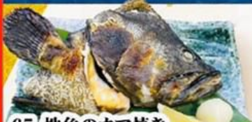
65. 地魚のカマ焼き Kamayaki (snapper, grouper) $14.8