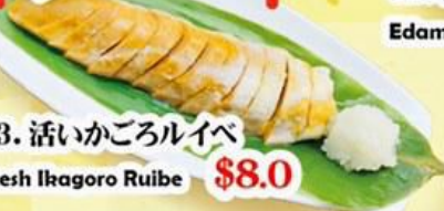
43. 活いかごろいべ Fresh Ibagoro Ruibe $8.0