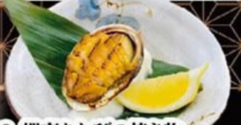
68. 蝦夷あわびの焼き物 Grilled Ezo Awabi $16.0