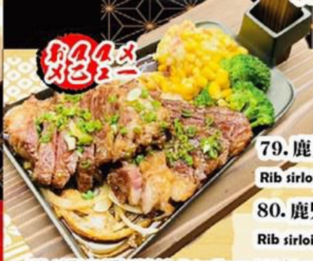
79. 鹿児島和牛 A4 リブ / サーロインステーキ (150g) Rib sirloin steak Kagoshima wagyu A4 150g $39.9