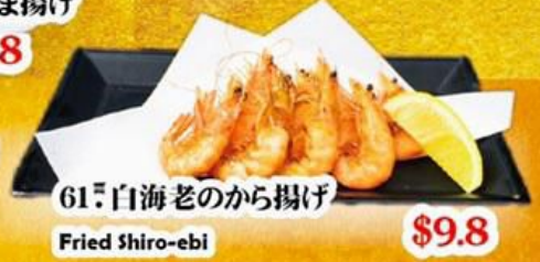
61. 白海老のから揚げ Fried Shiro-ebi $9.8