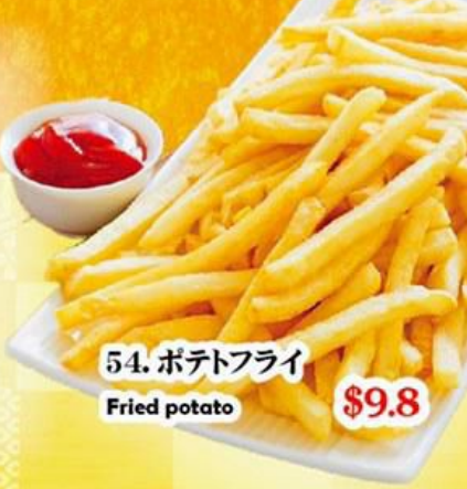
54. ポテトフライ Fried potato $9.8