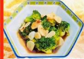
74. ブロccoliのんにく炒め Stir Fried Broccoli with Garlic $9.8