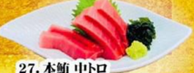
27. 本鮪 中トロ $19.8 Hon Maguro Chutoro