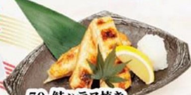
70. 鮭ハラス焼き Grilled Salmon Belly $9.8