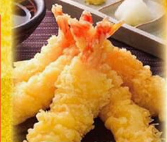
53. 海老の天ぷら Prawn Tempura $12.8