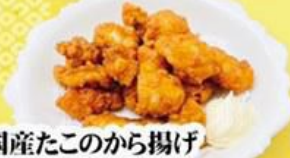
59. 国産たこのから揚げ Fried Tako (Octopus) $9.8