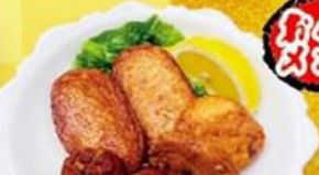
60. 鹿児島産三種のさつま揚げ 3Kind Satsuma Age $9.8