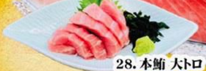
28. 本鮪 大トロ $21.8 Hon Maguro Ootoro