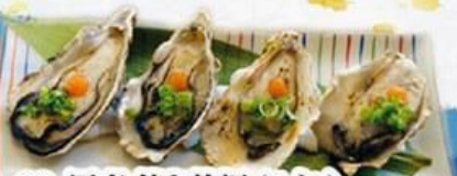
63. 国産 焼き牡蠣 (4ヶ) Grilled Oyster (4pcs) $16.8