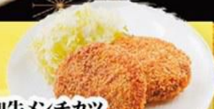
57. 和牛メンチカツ Minced Beef Cutlet $12.8