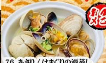
76. あさり / はまぐりの酒蒸し Sahamushi (Clams/Hamaguri) $9.8