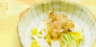
45. 白菜の浅漬 Chinese Cabbage Asazuke $8.0