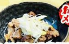
46. 国産牛の牛筋煮込み Stewed Beef $8.0