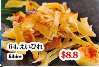
64. えいひれ Eihire $8.8