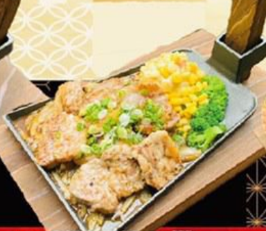
84. 黒豚特製カルビ焼 Kurobuta harubi yaki $29.8