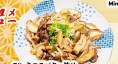
78. きのコバター炒め Stir Fried Mushroom with Butter $9.8