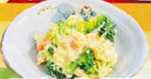
50. ブロッコリーサラダ Broccoli Salad $9.8