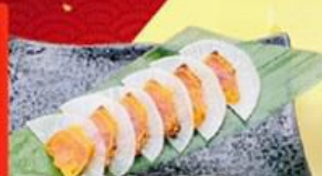
91. からすみ大根 Karasumi and Rdish $8.8