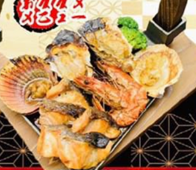
85. 特製海鮮焼き Special seafood yaki $34.8