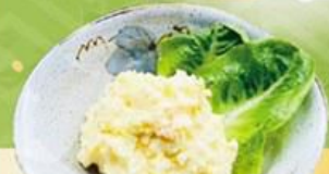
51. ごろごろポテトサラダ Potato Salad $9.8