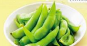
41. 枝豆 Edamame $8.0