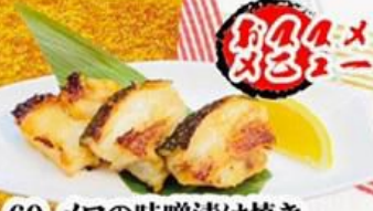
69. メロの味噌漬け焼き Grilled Mero (Miso Yahi) $9.8