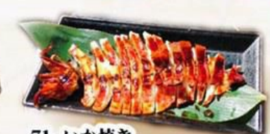
71. いか焼き Grilled Squid $8.8