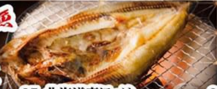
97. 北海道真ほっけ Hokkaido MaHokke $14.8

67. 本日のお薦め焼き魚 Today's Grilled Fish 量り売り 100g / $10 内容はスタッフまでお尋ね下さい。 Whole Fish $10 Per 100g. Please inquire the staff about selections.