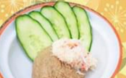
40. 国産かにみそ Kani Miso $8.0