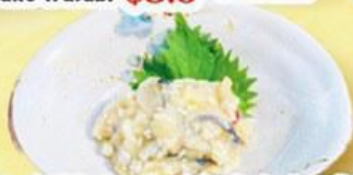
42. 和製アンチョビ (にしんの切込) Japanese Anchovies $8.0