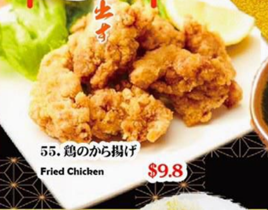
55. 鶏のから揚げ Fried Chicken $9.8