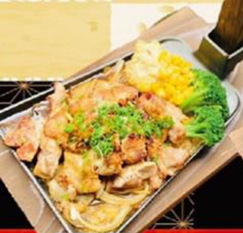
83. 特製鶏焼き Special chicken yaki $24.8