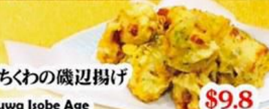
62. ちくわの磯辺揚げ Chikuwa Isobe Age $9.8