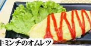
77. 和牛ミンチのオムレツ Minced wagyu omelet $9.8