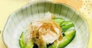
44. 塩だれピーマン Shiodare Capsicum $8.0