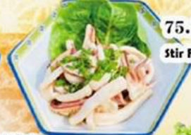
75. いかのバター炒め Stir Fried Squid with Butter $9.8