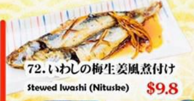
72. いわしの梅生姜風煮付け Stewed Iwashi (Nituske) $9.8