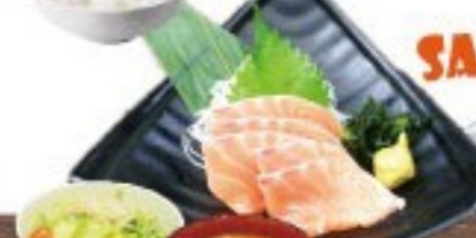
445. サーモン刺身定食 Salmon Sashimi Set $ 9.8+