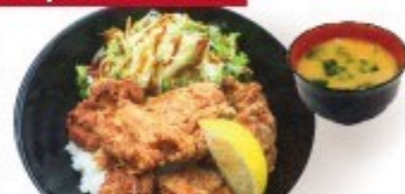
428. 唐揚げ丼 Karage Donburi $ 7.8+