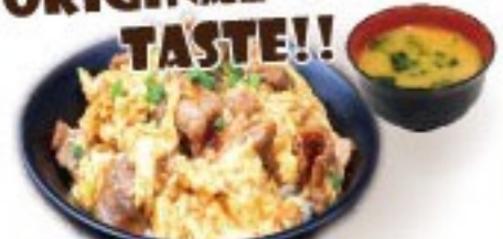
429. 肉玉丼 Nikutama Donburi $ 9.8+