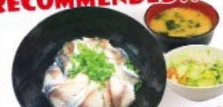
431. しめ鯖丼 SHIME SABA Donburi $ 11.8+