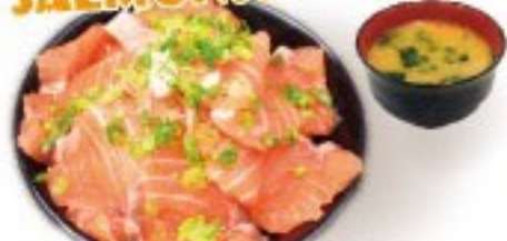
423. 魚王魚王のサーモン丼 Salmon Donburi Set $ 9.8+