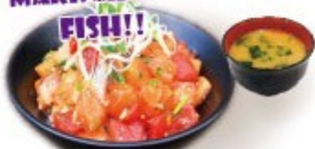
427. 魚王魚王のツケ丼 Uouo Duke donburi $ 11.8+