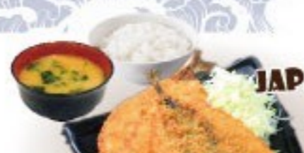
440. 山口萩産瀬付アジフライ定食 Aji Fry Set $ 15.8+