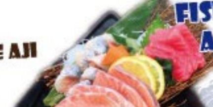
443. 魚王魚王のおすすめ刺身定食 UOUO Osusume Sashimi Set $ 18.8+