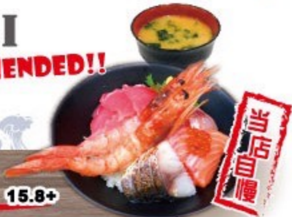
420. 魚王魚王の海鮮丼 UOUO Kaisen Donburi $ 15.8+