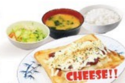
437. チーズ餃子定食 Cheeze Gyoza Set $ 8.8+