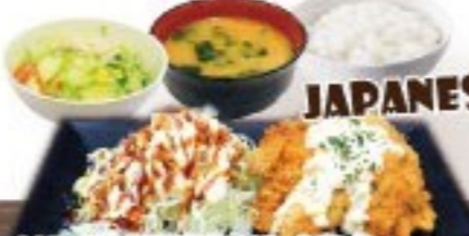
445. 国産牡蠣フライ定食 Kokusan Oyster Fry Set $ 15.8+