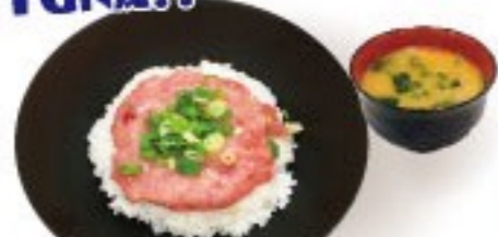
426. ねぎとろ丼 NEGITORO(Tuna) Donburi $ 12.8+