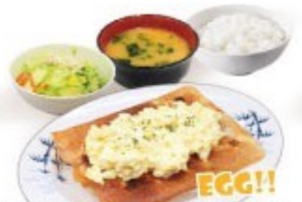
435. スプレッドエッグ餃子定食 Spread Egg Gyoza Set $ 8.8+