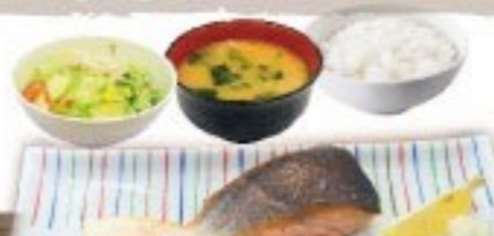
446. 鮭塩焼定食 Salmon Shioyaki Set $ 10.8+