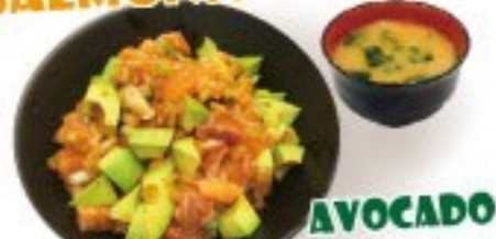
425. サーモンポケ丼 Salmon Poke Donburi $ 7.8+