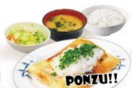
438. おろしポン酢餃子定食 Oroshi ponzu Gyoza Set $ 8.8+