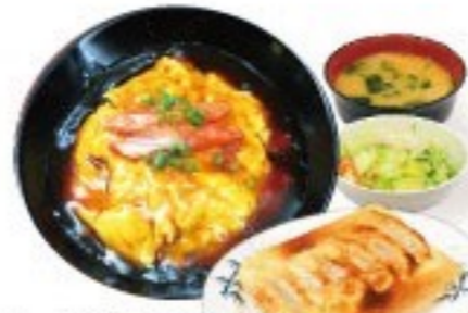
439. 餃子天津飯定食 Gyoza Tenshin Han Set $ 14.8+