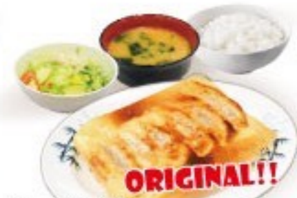
434. 餃子定食 Gyoza Set $ 7.8+