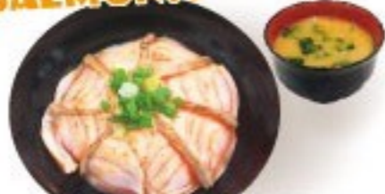
424. 魚王魚王のサーモン炙り丼 Aburi Salmon Donburi $ 9.8+