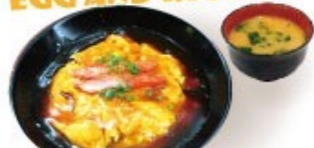
430. 天津飯 Tenshin Han $ 8.8+