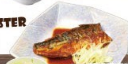
444. 鯖味噌煮込み定食 Saba Misonikomi Set $ 9.8+