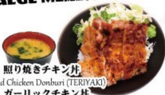
421. 照り焼きチキン丼 Grilled Chicken Donburi (TERIYAKI) $ 6.8+ 422. ガーリックチキン丼 Grilled Chicken Donburi (Garlic)