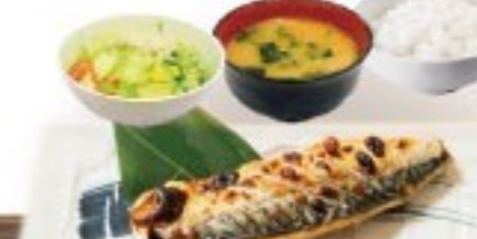
442. さば塩焼定食 Saba Shioyaki Set $ 10.8+