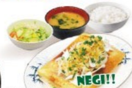
436. ねぎ塩餃子定食 Negishio Gyoza Set $ 8.8+