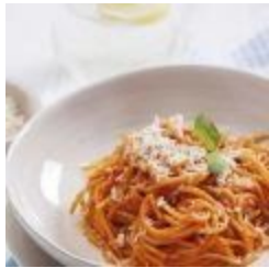
Spaghetti Napoletana (v)