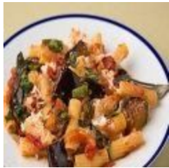
Rigatoni alla Siciliana (v)