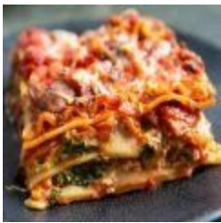
Lasagna Vegetariana (v)