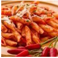
Penne Diavolata (v)