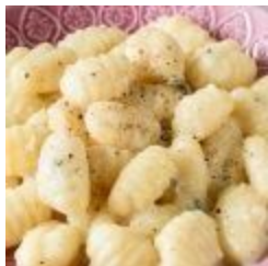
Gnocchi 4 Formaggi (v)