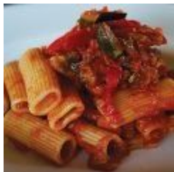
Rigatoni dell' Orto (v)