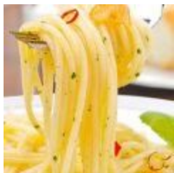
Spaghetti Zingara (v)