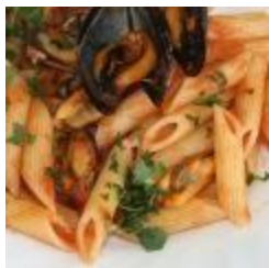
Penne alle Cozze (v)