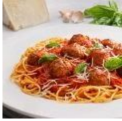
Spaghetti con Polpette