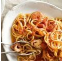
Linguine alla Marinara