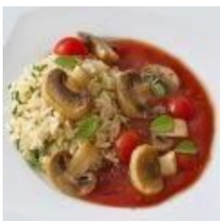
Risotto alla Montanara (v)