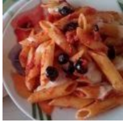
Penne al Tonno