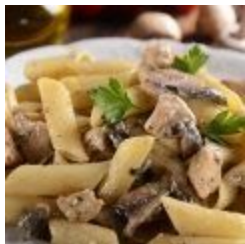
Penne all'Amaretto (v)