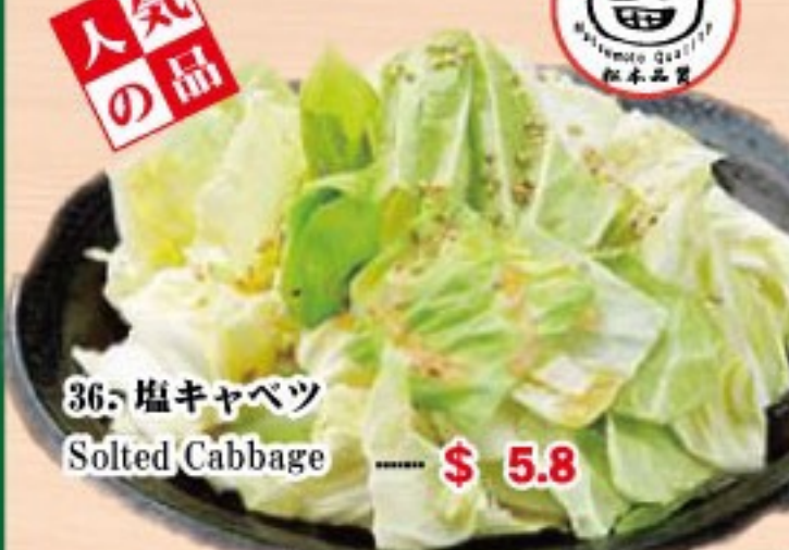
36. 塩キャベツ Salted Cabbage