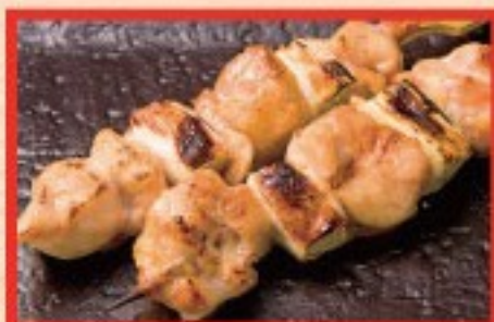
81. ねぎま Grilled Chicken and spring onion ..... $ 2.5