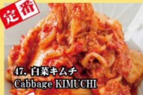
47. 白菜キムチ Cabbage KIMUCHI