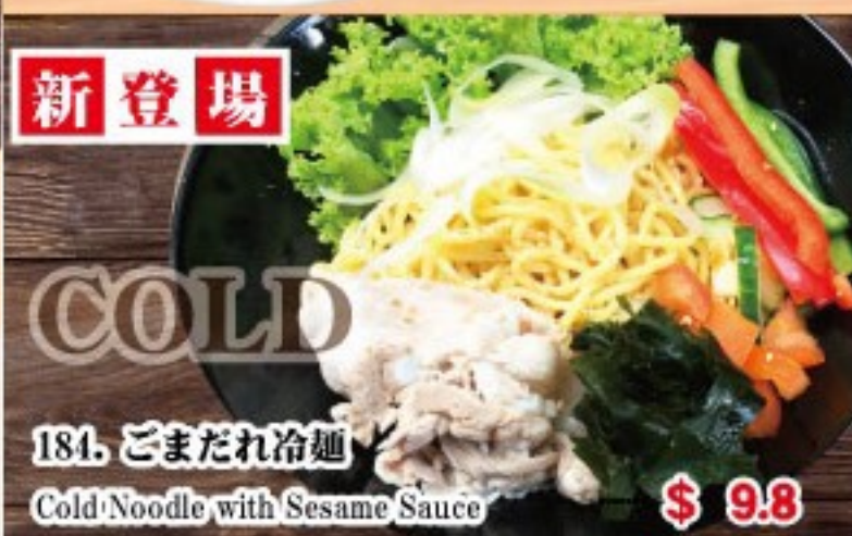
184. ごまだれ冷麺 Cold Noodle with Sesame Sauce ..... $ 9.8