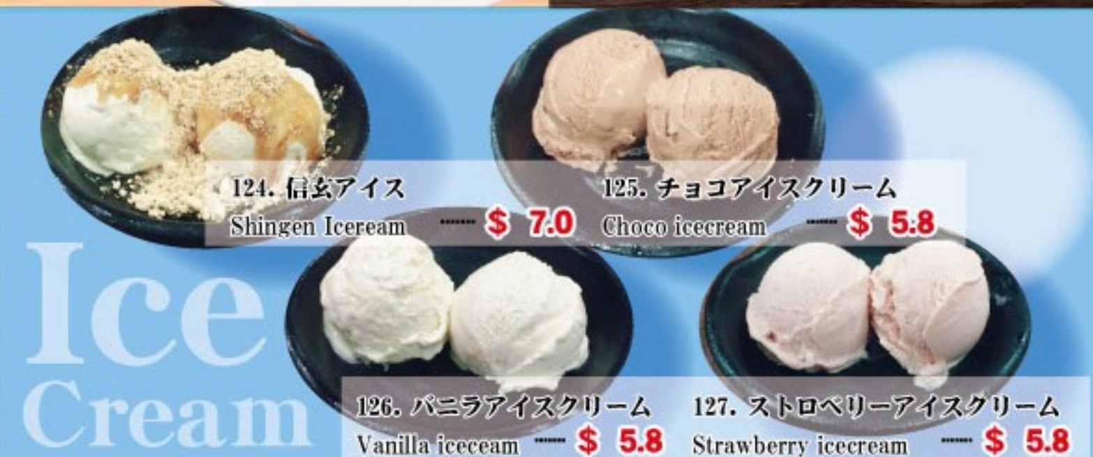
124. 信玄アイス Shingen Icecream ..... $ 7.0