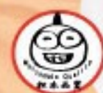
140. 焼肉王焼きそば Yakiniku-Oh Yakisoba ..... $ 11.8