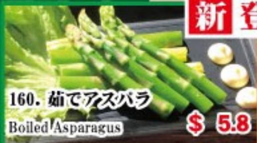
160. 茹でアスパラ Boiled Asparagus