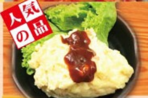
53. 美味しいポテトサラダ