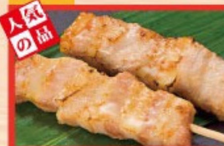
93. とんかつ Grilled Fatty pork ..... $ 2.5