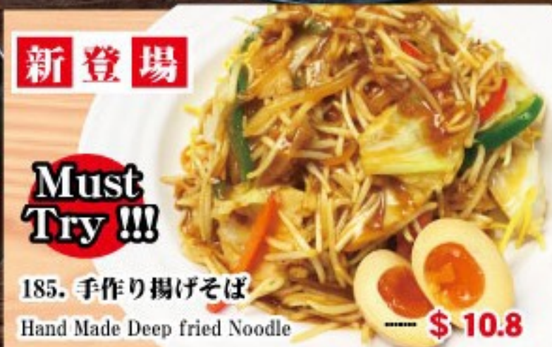
185. 手作り揚げそば Hand Made Deep fried Noodle ..... $ 10.8