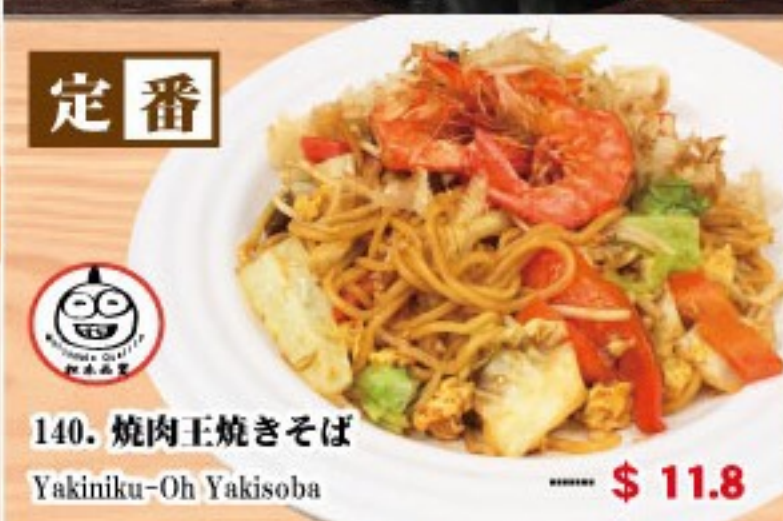
140. 焼肉王焼きそば Yakiniku-Oh Yakisoba ..... $ 11.8