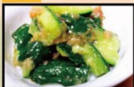
42. 塩だれ梅キュウリ

dried young sardines and daikon grater $ 5.8