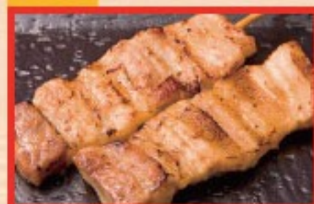
92. 豚バラ Grilled Pork belly ..... $ 2.5