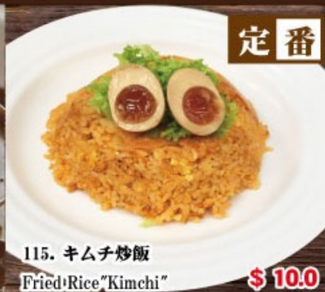
115. キムチ炒飯 Fried Rice "Kimchi" ..... $ 10.0