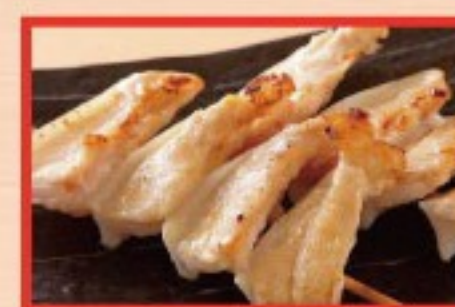
91. やげんなんこつ Grilled Y shape gristle ..... $ 2.5