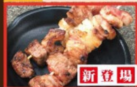
145. 国産牛 Grilled Japanese Beef ..... $ 3.0