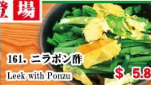
161. ニラポン酢 Leek with Ponzu