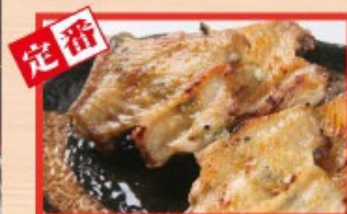
89. 手羽先 Grilled Chicken wings ..... $ 2.5

焼鳥、やきとん、野菜の串焼の注文は 2本からでお願いします。 Please order 2 Pcs for Yakitori, Yakitori, vegetable skewers.