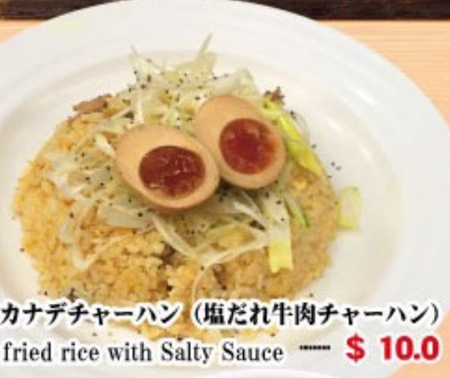
152. カナデチャーハン (塩だれ牛肉チャーハン) Beef fried rice with Salty Sauce ..... $ 10.0