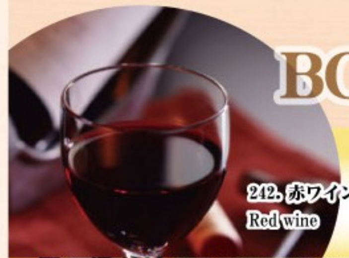
242. 赤ワイン Red wine