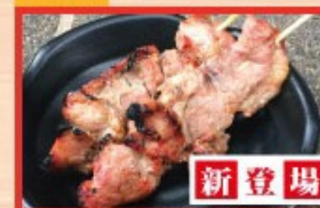
147. ラム Grilled Lamb ..... $ 2.5