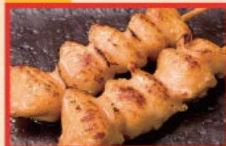
85. ぼんじり Grilled Chicken tail ..... $ 2.5