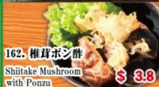
162. 椎茸ポン酢 Shiitake Mushroom with Ponzu