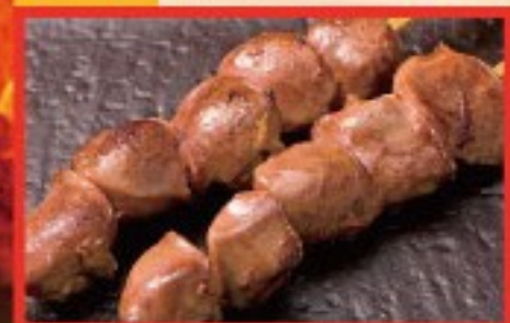
83. 砂ぎも Grilled Chicken gizzard ..... $ 2.5