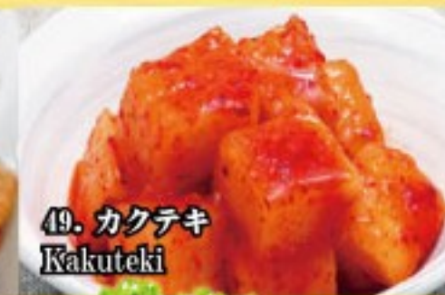
49. カクテキ Kakuteki