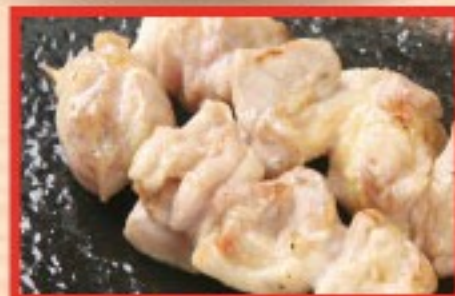
82. むね Grilled Chicken breast ..... $ 2.5