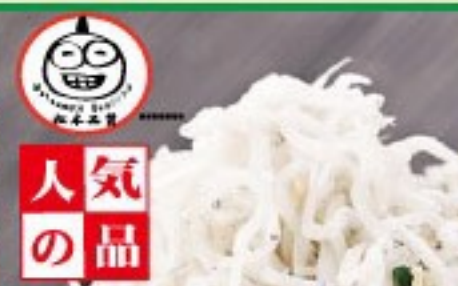
45. 旨い! しらすねぎ dried young sardines with Spring Onion