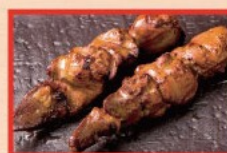
90. 鶏レバー Grilled Chicken Liver ..... $ 2.5