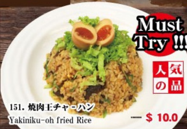
151. 焼肉王チャーハン Yakiniku-oh fried Rice ..... $ 10.0