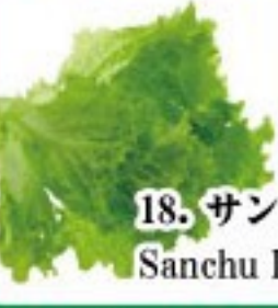
18. サンチュ (包み野菜)