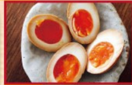
40. 味玉 AJITAMA