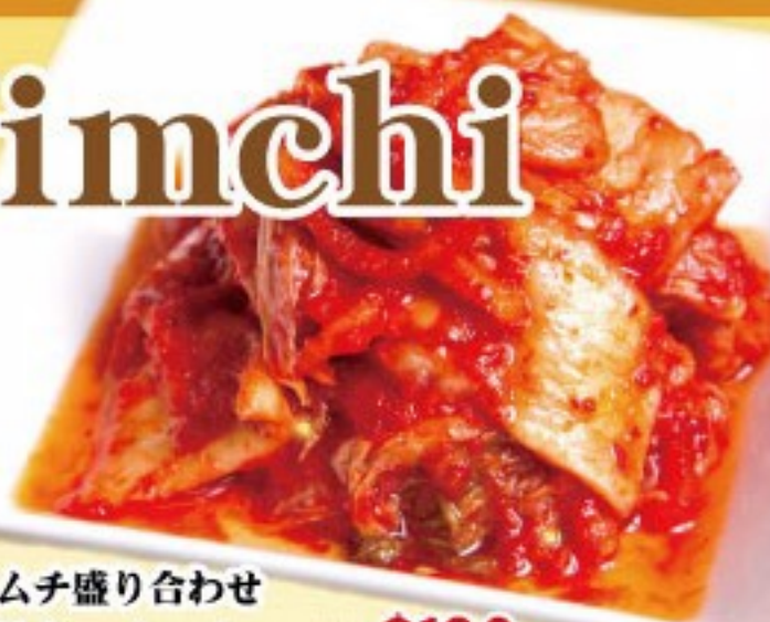
46. キムチ盛り合わせ