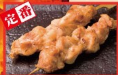
80. もも Grilled Chicken leg ..... $ 2.5