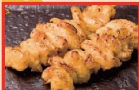
84. 皮 Grilled Chicken skin ..... $ 2.5