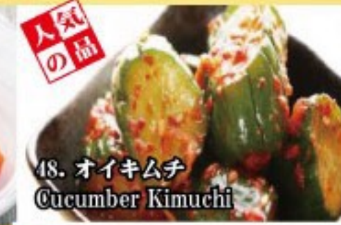
48. オイキムチ Cucumber Kimuchi