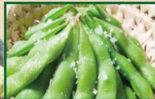
37. 枝豆 Edamame