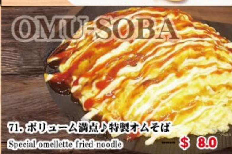
71. ボリューム満点! 特製オムそば Special omellette fried noodle ..... $ 8.0