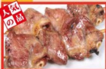
87. はつ (心臓) Grilled Chicken hearts ..... $ 2.5