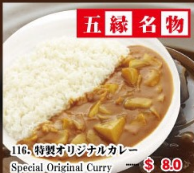
116. 特製オリジナルカレー Special Original Curry ..... $ 8.0