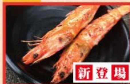
146. 海老 Grilled Prawn ..... $ 2.5