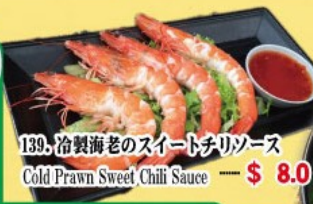
139. 冷製海老のスイートチリソース