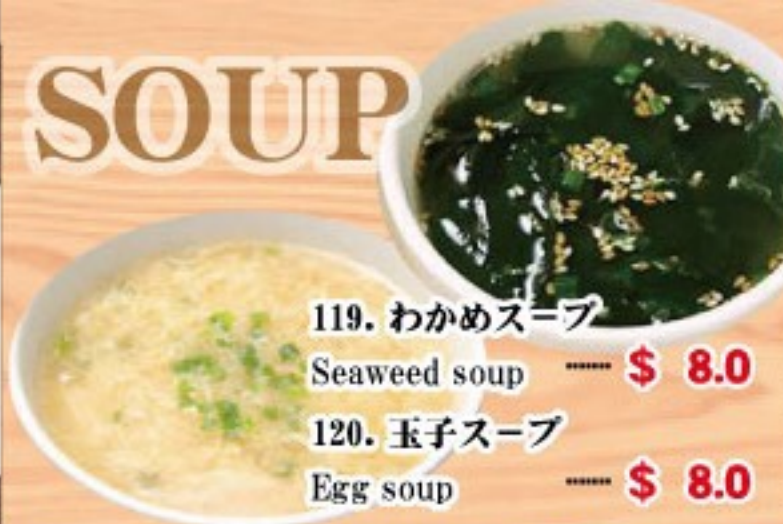
119. わかめスープ Seaweed soup ..... $ 8.0 120. 玉子スープ Egg soup ..... $ 8.0