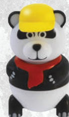
Pan Dan gelato al vaniglia € 3.50