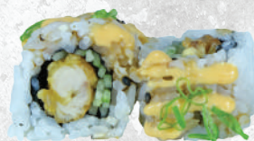
160. Karaage roll 🍣 Karaage, cetriolo, maio, salsa spicy, erba cipollina € 11.00