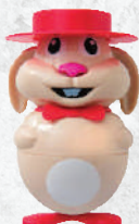
Rabbit gelato al fiordilatte € 3.50