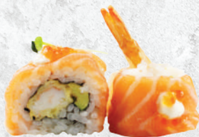
97. Tiger roll gambero* tempura, avocado, salmone e tobiko* € 10.00