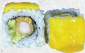
94. Mango roll gambero fritto*, avocado, mango € 10.00