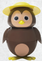
Cip Ciok gelato al cioccolato € 3.50