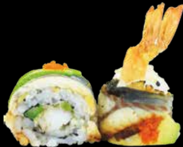
100. Spicy unagi 🍣 gambero tempura, avocado, anguilla, tobiko, salsa spicy* € 11.00