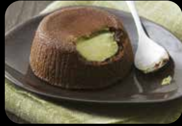
Soufflé al Pistacchio soufflé con cuore al pistacchio liquido € 5.00