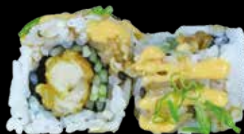
160. Karaage roll 🍣 Karaage, cetriolo, maio, salsa spicy, erba cipollina € 11.00