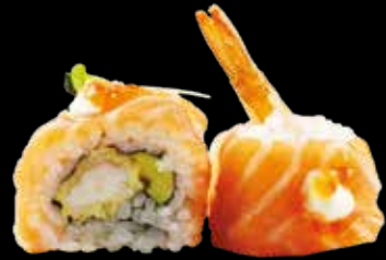
97. Tiger roll gambero* tempura, avocado, salmone e tobiko* € 10.00