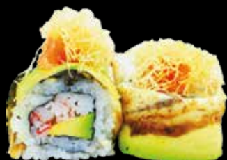
102. Okaeri roll anguilla*, granchio*, avocado, tartare di salmone e kataifi € 12.00