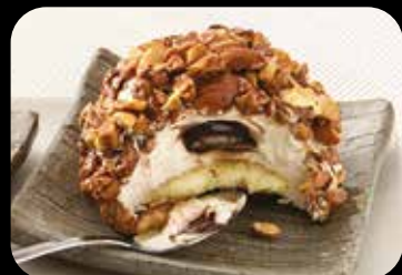
Croccante alle Mandorle dessert semifreddo con crema alla nocciola. cuore morbido al cioccolato, decorato con mandorle caramellate € 5.00