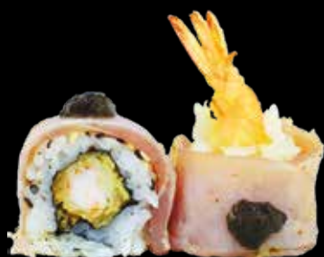
104. Tartufo tuna roll gambero* tempura, tonno scottato, salsa tartufo € 12.00