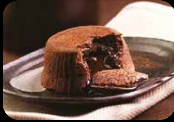
Soufflé al Cioccolato soufflé con cuore di cioccolato liquido € 5.00