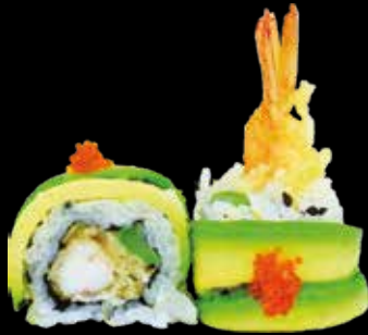
96. Dragon roll gambero* tempura, asparagi, maionese, avocado e tobiko* € 11.00