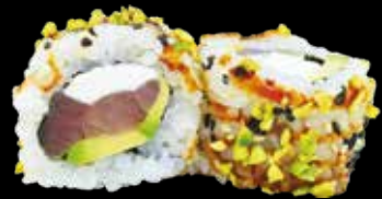
99. Pistacchio tuna roll tonno, philadelphia, avocado e pistacchio € 11.00