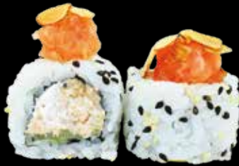
98. Almond philadelphia salmone cotto, cetriolo, philadelphia, salmone, tartare e mandorle € 10.00