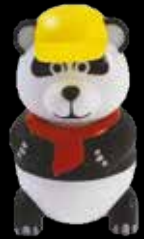
Pan Dan gelato al vaniglia € 3.50