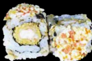
158. Ebiten plus 🍣 gambero* tempura, maio, surimi*, tobiko € 11.00