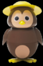
Cip Ciok gelato al cioccolato € 3.50