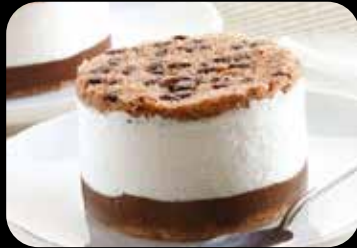
Ricotta e cioccolato Morbidi biscotti al cacao, nociola e gocce di cioccolato con crema alla ricotta € 5.00