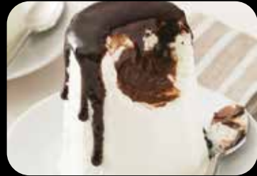
Semifreddo Menta e Cioccolato gelato semifreddo alla menta con cuore di semifreddo € 5.00