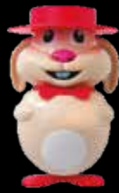
Rabbit gelato al fiordilatte € 3.50