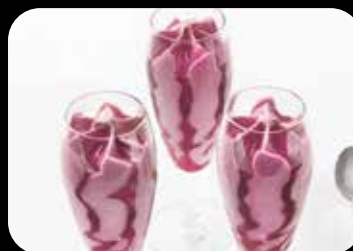
Tris di Sorbetti degustazione di sorbetti € 4.50