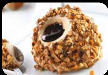
Tartufo Nocciola gelato semifreddo alla nocciola con cuore di cioccolato liquido, decorato con nocciole pralinate e meringa € 5.00