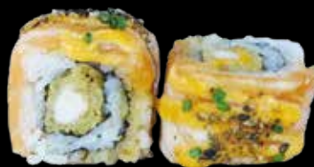
103. Tiger special 🍣 gambero* tempura, salmone scottato, maio, salsa spicy € 11.00