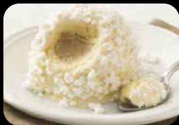
Tartufo Bianco gelato semifreddo allo zabaione con cuore di gelato al caffè decorato con granella di mering € 5.00