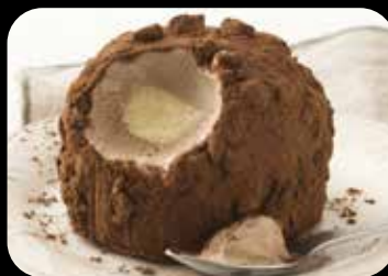
Tartufo Classico gelato semifreddo allo zabaione con cuore di gelato al cioccolato, decorato con granella di nocciole e cacao € 5.00