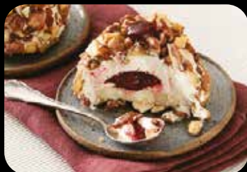
Croccante All'Amarena dessert semifreddo con crema al gusto vaniglia. cuore morbido all'amarena, decorato con mandorle caramellate € 5.00