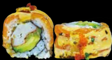
159. Fresh roll 🍣 surimi*, avocado, cetriolo, maio, salmone e lime, tobiko*, salsa spicy, erba cipollina € 12.00