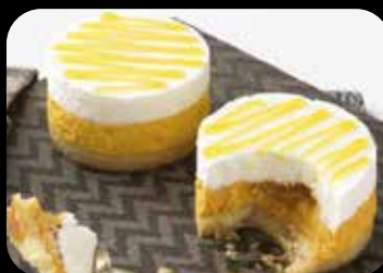
Agrumi di Sicilia crema semifredda al mandarino tardivo di Ciaculli e crema semifredda al limoni siciliani, con un cuore liquido agli agrumi, su una base di Pan di spagne € 5.00