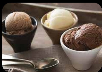
Tris di Creme degustazione di creme gelato € 4.50