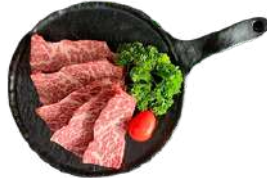
꽃 갈비살 Short Rib 180G