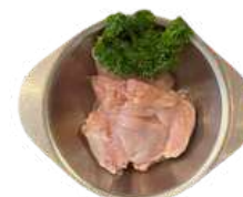
뼈 없는 순살 치킨 $26 Boneless Plain Chicken 250G