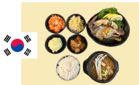
3. 밥과 찌개 한국 간장게장 세트 $28 K-Soy Marinated Crab, Soup & Rice set