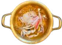
Crab Ramen 꽃게 라면