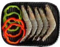
왕 새우 King Prawn 5PCS