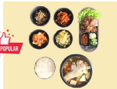
7. 밥과 찌개 바베큐 세트 $24 BBQ, Soup & Rice set