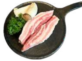
흑돼지 냉장 삼겹살 $38 Chilled Premium Black