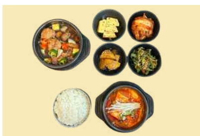
2. 밥과 찌개 찜닭 세트 $20 Braised Chicken, Soup & Rice set