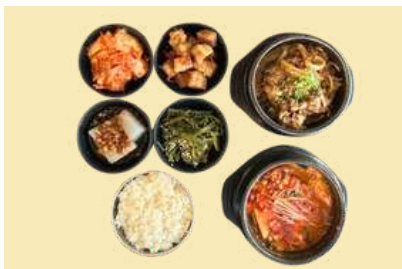
5. 밥과 찌개 소떡배기 세트 $21 Soy Beef Bulgogi Hot Pot, Soup & Rice set

Each Combo Set comes with one pack of seasoned seaweed and salted squid. 콤보세트 주문시, 조미김 1팩과 오징어 젓갈이 제공 됩니다.