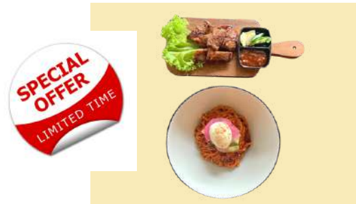
8. 면과 바베큐 세트 $22 BBQ, Soup & Noodle set