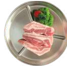
듀록 삼겹살 $28 Duroc Pork Belly 180G