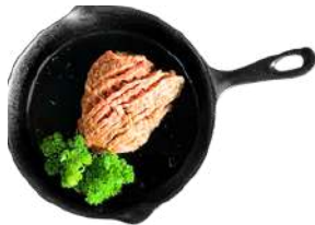
양념 소 갈비 Marinated Beef Rib 220G