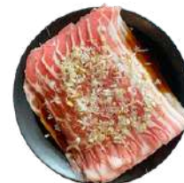
양념 대패삼겹살 $58 Marinated Planer Belly (Marinated Sliced Pork Belly) 2 PORTION - 360G