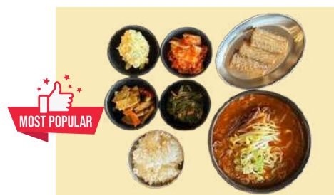
4. 밥과 탕(찌개) 갈치구이 4pcs 세트 $20 Ribbon Fish (4pcs), Soup & Rice set