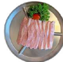
항정살 $30 Pork Jowl Meat 180G