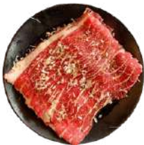
양념 우삼겹 Marinated Short Plate 2 PORTION - 360G