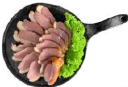
훈제 오리 Smoked Duck 180G