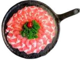
우설 Beef Tongue 150G