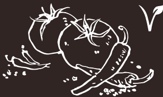
G7 Pomodoro Piccante Spicy Tomato 8.00