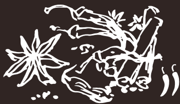
G1 Peperocino Rosso Red Pepper 9.00