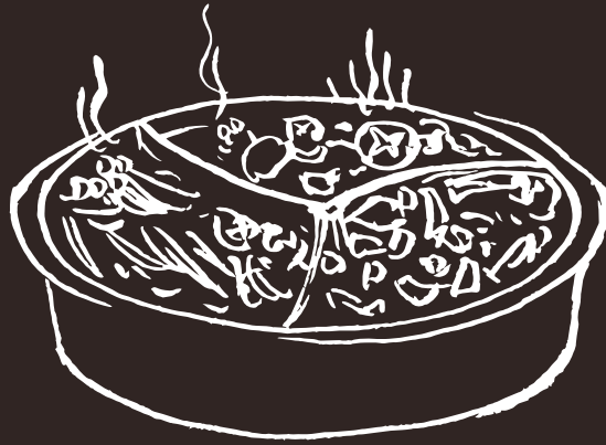
GS Tre Gusti Three Flavors 12.00