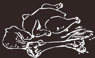
G2 (11) Little Lamb Classico Little Lamb Classic 7.00