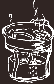
GD Pentola Piccola X Sala Privata Single Small Pot (Private Booth only) 4.00