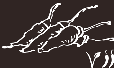
G5 Peperocino Verde Green Pepper 8.00