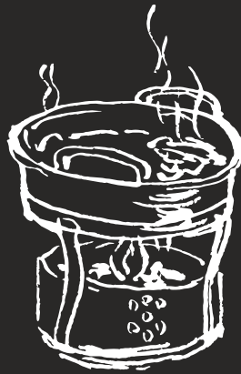
GD 包間單味小鍋 4.00