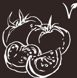
G4 Pomodoro Tomato 7.00