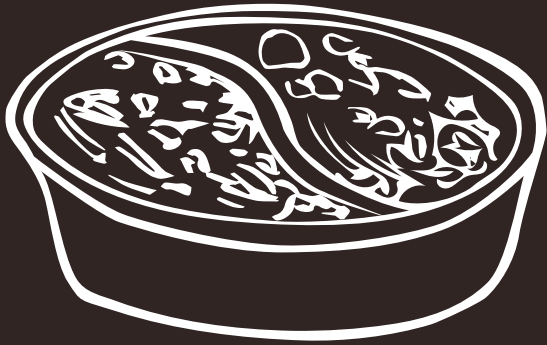
GY Due Gusti Two Flavors 11.00