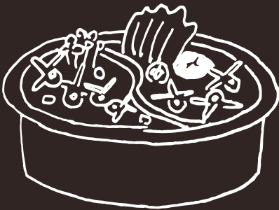
GJ Osso di Agnello Due Gusti Lamb Bones With Two Flavors 20.00