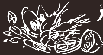
G9 (2,4,7) Tom Yum Kung Tom Yum Kung 8.00