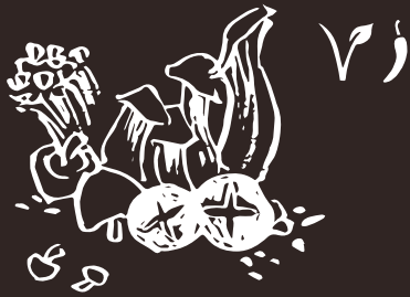
G6 Funghi Mushroom 7.00