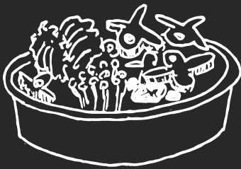
GJ 羊蝎子 18.00 鴛鴦羊蝎子 20.00