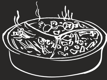
GS 三味 12.00