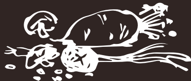
G3 (2) Brodo Di Pechino Beijing Broth Soup 7.00