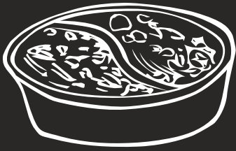
GY 鴛鴦 11.00