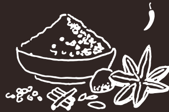
G10 (6) Curry Curry 8.00