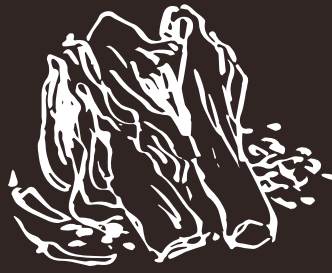
G8 Crauti Chinese sauerkraut 7.00