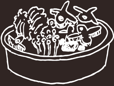
GJ Osso di Agnello Lamb Bones 18.00