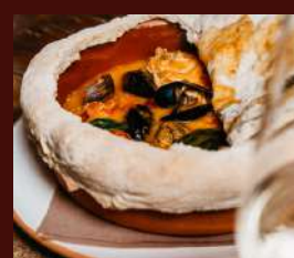
Zuppa di pesce in cocchio