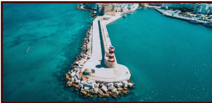
Il Faro Rosso di Monopoli, immerso nella vita caotica dei pescatori e del molo, è basso e tozzo; alto solamente 15 metri e svolge una funzione di segnalamento all'ingresso del porto sin dall'anno 1878

Un nuovo luogo dai sapori e dai valori antichi. Il Cantinale è convivialità, amore per il buon vino e per il buon cibo. Un luogo nel cuore del centro storico di Monopoli, dove storia e tradizione si intrecciano con modernità e innovazione al fine di restituire al passato un tempo nuovo.