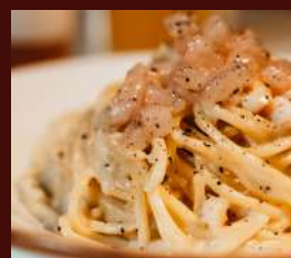
Con tartare di gamberi, pecorino romano e pepe

Spaghettoni cacio e pepe di mare - Zuppeta di pesce