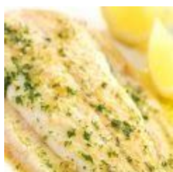
Sogliola alla Mugnaia