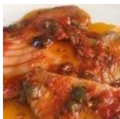
Tonno alla Pizzaiola