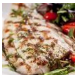
Sogliola alla Griglia