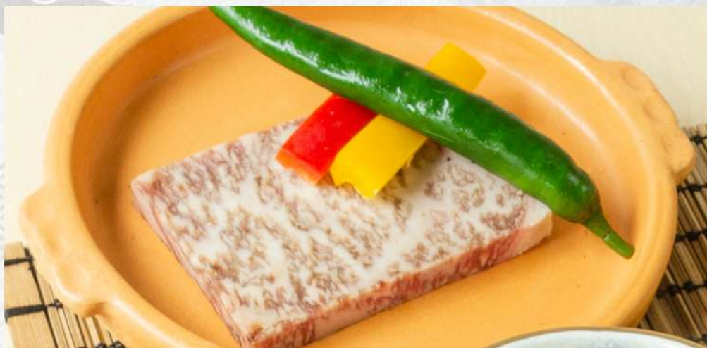
Hokkaido Wagyu A4 Sirloin Steak (100g) 北海道和牛A4サーロインステーキ(100g)