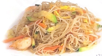
小 (piccolo) € 6,00 8,00 | 中 (medio) € 8,00 12,00 | 大 (grande) € 18,00 20,00