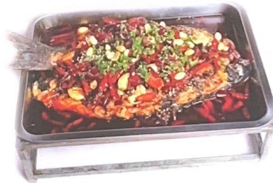
73. 诸葛烤鱼 | € 38,00 Pesce piccante al zhuge