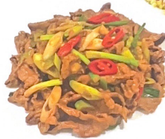
64. 酱爆牛排 | € 25,00 Spezzatini di filetto saltato