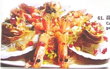
61. 蒜蓉双鲜 | S.Q Capesante e gamberoni* all' aglio