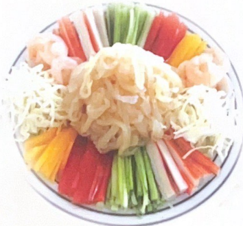
60. 葱油三脆 | € 18,00 Seafood con flammulina