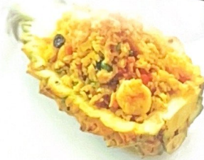
94. 菠萝虾仁炒饭 | € 8,00 Riso saltato con gamberi e ananas