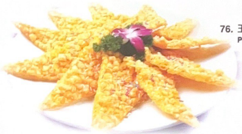
76. 玉米烙 | € 10,00 Prepes di mais