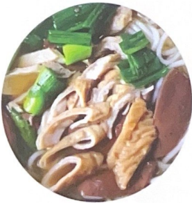
103. 猪脏粉 | € 8,00 | € 12,00 | € 18,00 Spaghetti di soia con intestino di maiale piccante in brodo