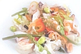
59. 煌上煌小炒煌 | € 18,00 Misto pesce saltato all' imperiale