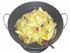
93. 干锅球菜 | € 10,00 12,00 Scodella di fuoco con cavolo piccante