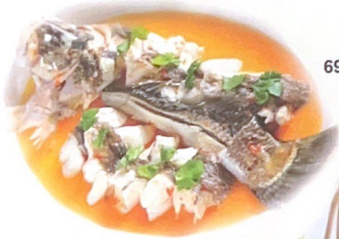
69. 鲈鱼卷香菇 | € 35,00 38,00 Branzino con funghi