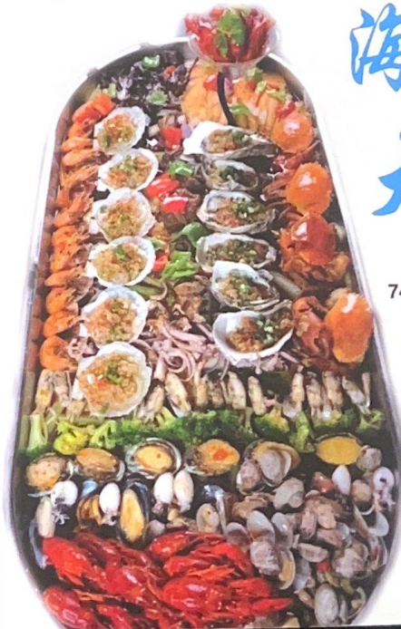
74. FRUTTI DI MARE PARTY*