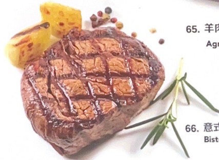
66. 意式牛排 | € 28,00 Bistecca alla griglia