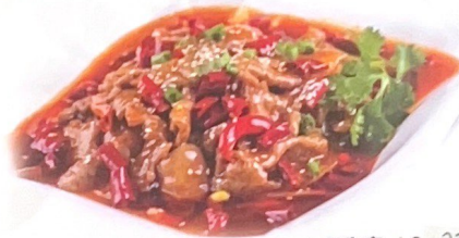
91. 水煮牛肉 | € 22€ Vitello con verdure bollite piccante