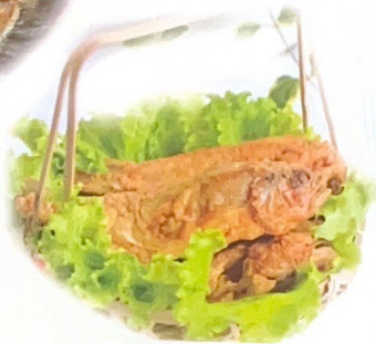
71. 水煮鱼 | € 28,00 Zuppa di pesce piccante