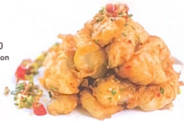
68. 椒盐水鱼 | € 28,00 Harpadon nehereus con sale e pepe