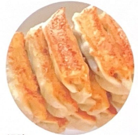
113. 锅贴 | € 6,00 | € 12,00 | € 15,00 Ravioli alla griglia*