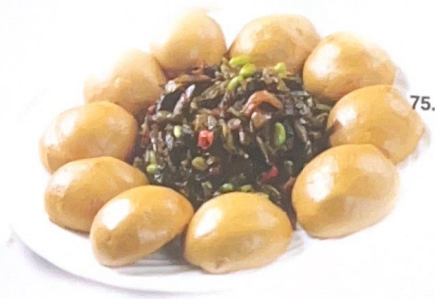
75. 窝窝头 | € 15,00 Pane cinese al vapore con contorno verdure miste in salamoia*