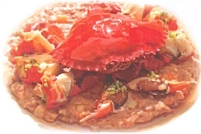
58. 南瓜蒸希腊蟹 | S.Q Granchio * greco con zucca al vapore