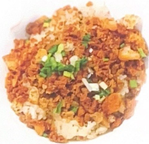
102. 老鸭粉干汤 半只 | € 28,00 整只 | € 48,00 Spaghetti di riso con anatra in brodo