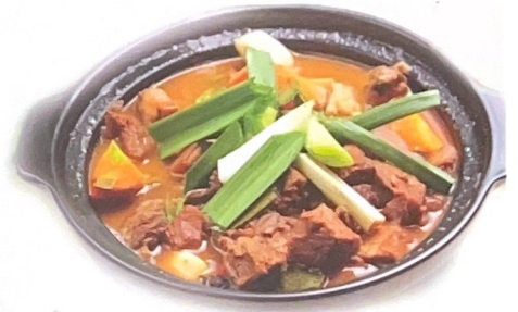
65. 羊肉煲 大份 | € 25,00 28,00 Agnello in tegame