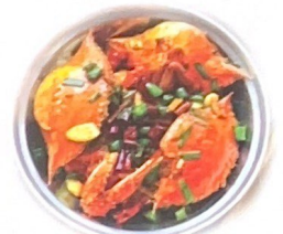
92. 香辣蟹 | S.Q Granchio piccante