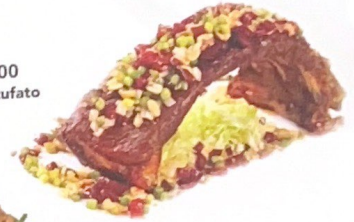
62. 过桥排骨 | € 16,00 Puntine di maiale stufato