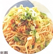
112. 拌面 | € 6,00 | € 12,00 | € 18,00 Insalata di spaghetti