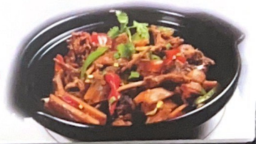
90. 湖南土匪鸭 | € 48 anatra, peperoncini, birra, peperoni