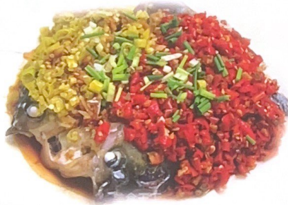
67. 剁椒鱼头 | S.Q Testa di pesce con peperoncino piccante