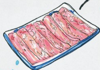
牛羊猪肉片 Fresh Beef/Lamb/Pork Slices