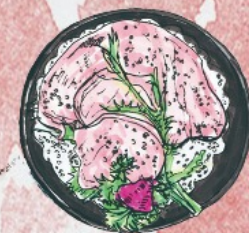
嫩滑鸡肉片 Fresh Chicken Slices