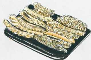
鲜毛肚 Fresh Tripes