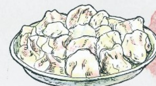
手工水饺 Hand Made Dumplings