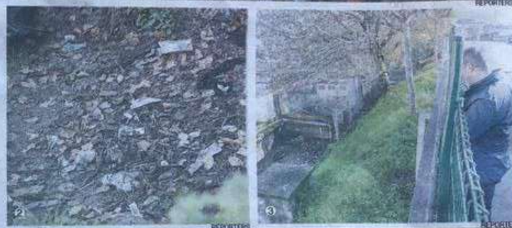
1. Siringhe tra i bambini ai giardinetti di via Macerata 2. e 3. Il cavalcavia di corso Sommeiller