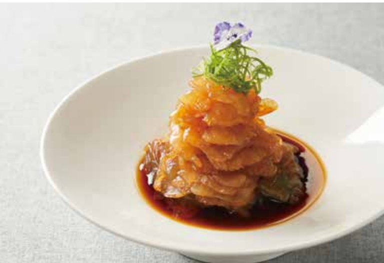
捞汁海蜇头 HERBAL WOOD EAR MUSHROOMS