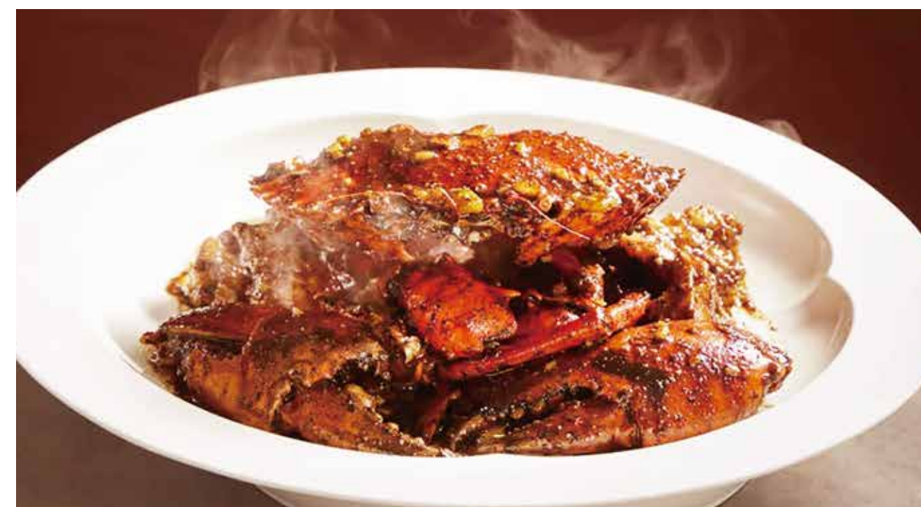
斯里兰卡蟹 ( 黑椒 | 辣椒 | 咸蛋黄 | 姜葱 ) SRI LANKAN CRAB