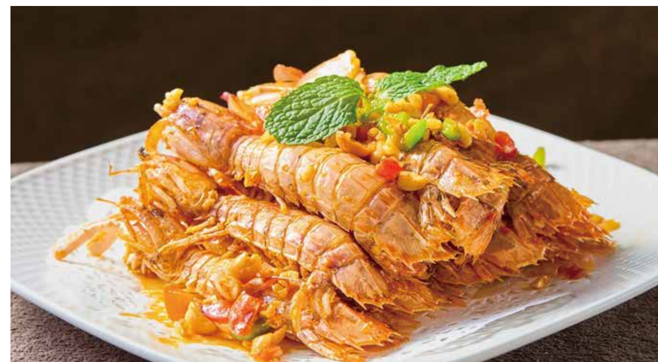
皮皮虾 ( 椒盐 | 香辣 ) MANTIS SHRIMP