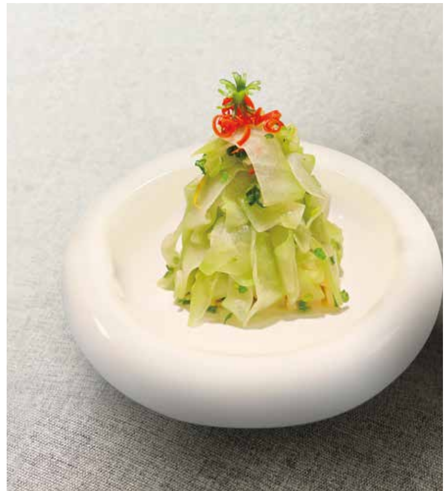
翡翠佛手瓜 JADE GREEN BUDDHA' S HAND MELON (CHAYOTE)