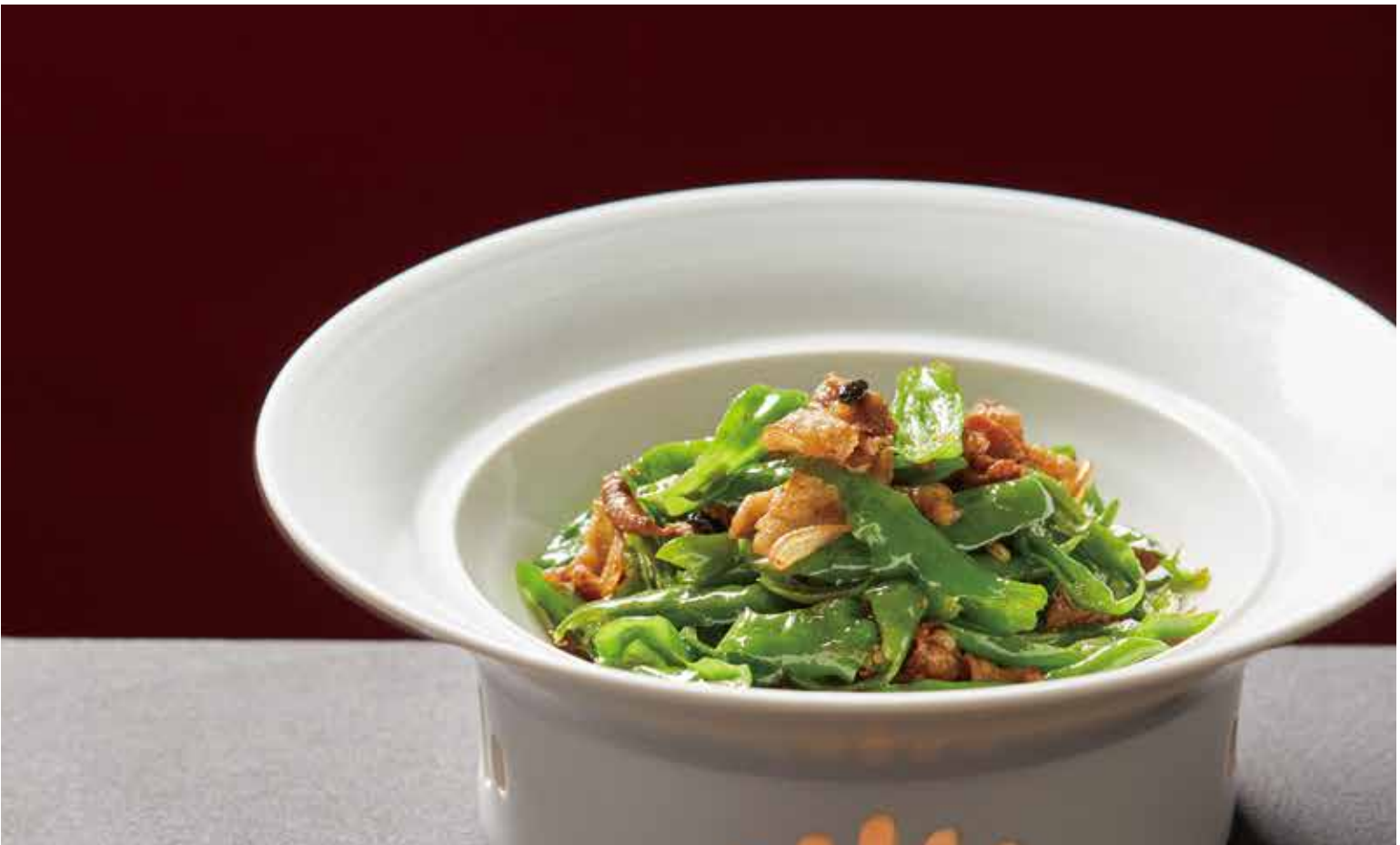
辣椒小炒肉 STIR-FRIED PORK WITH CHILI PEPPERS