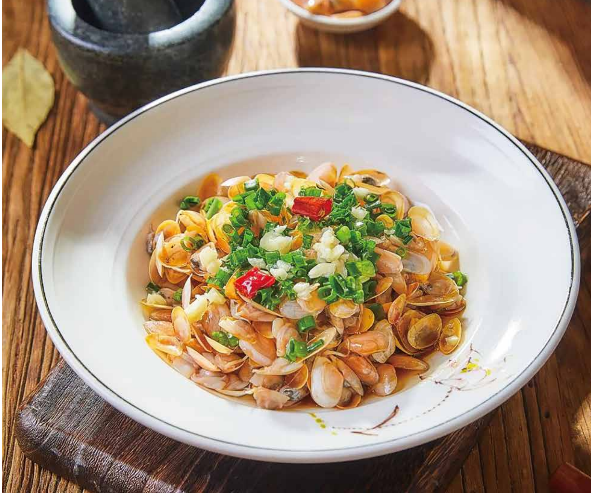
海瓜子 (姜葱 | 辣炒) SEA MELON SEEDS BABY CLAMS