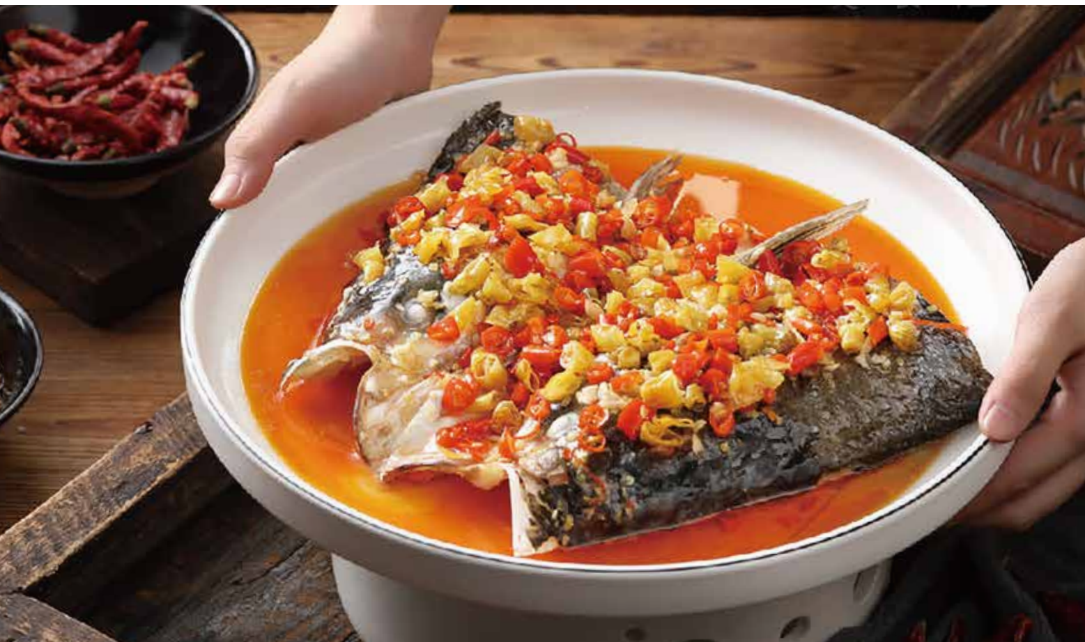
双椒鱼头 STEAMED FISH HEAD WITH FOUR CHILIS