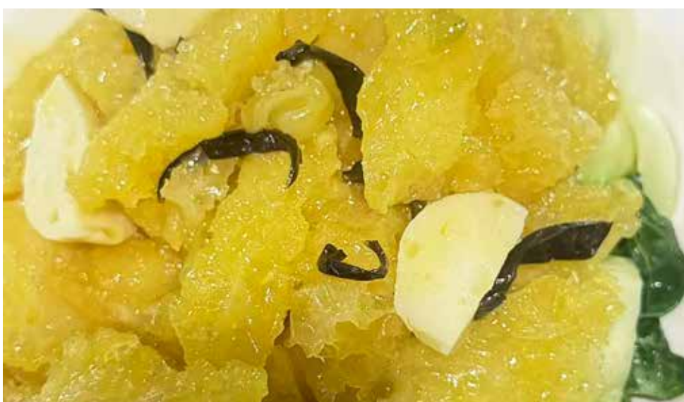
坡香烩鱼膘 BRAISED FISH MAW WITH AROMATIC HERBS