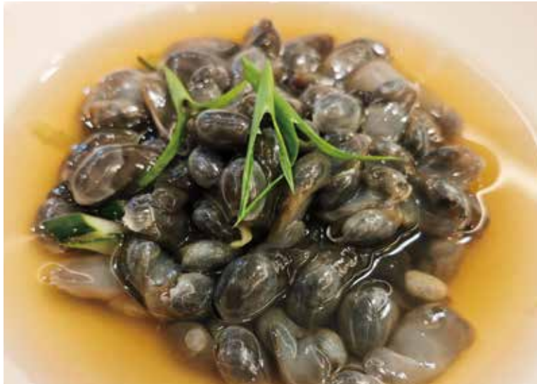
泥螺 MUD SNAIL