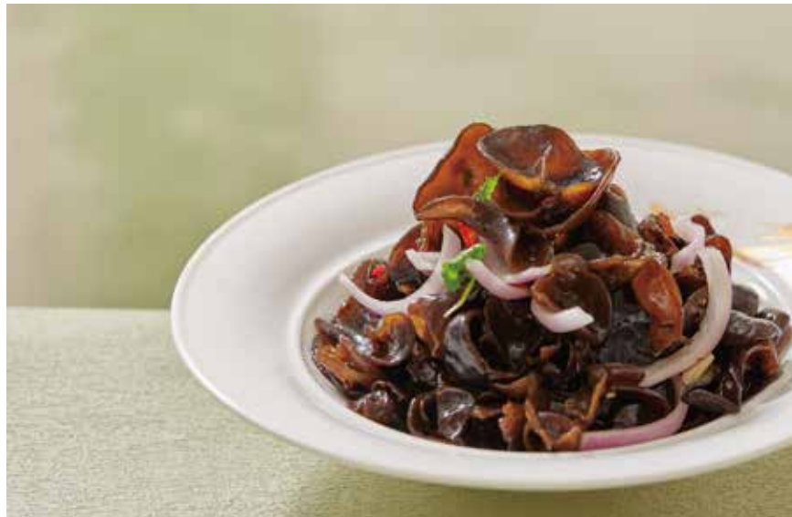
养生小木耳 HERBAL WOOD EAR MUSHROOMS