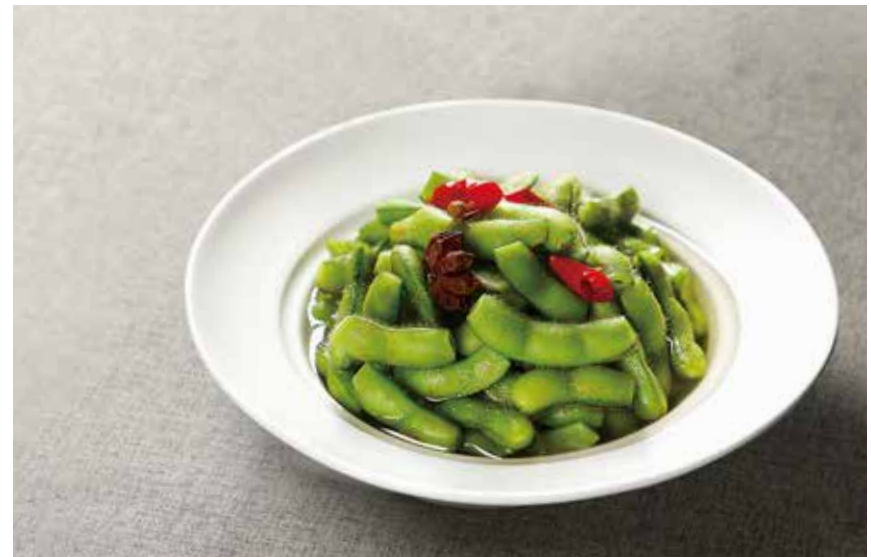
家常毛豆 HOME-STYLE EDAMAME