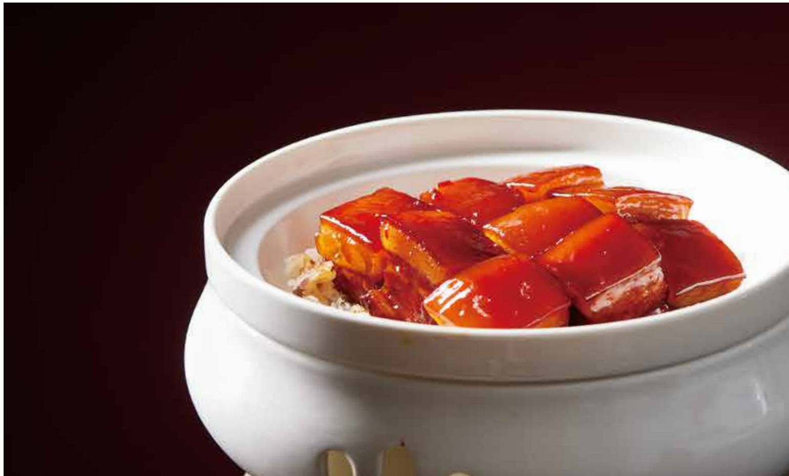
老淮阳红烧肉 CLASSIC HUAIYANG BRAISED PORK BELLY