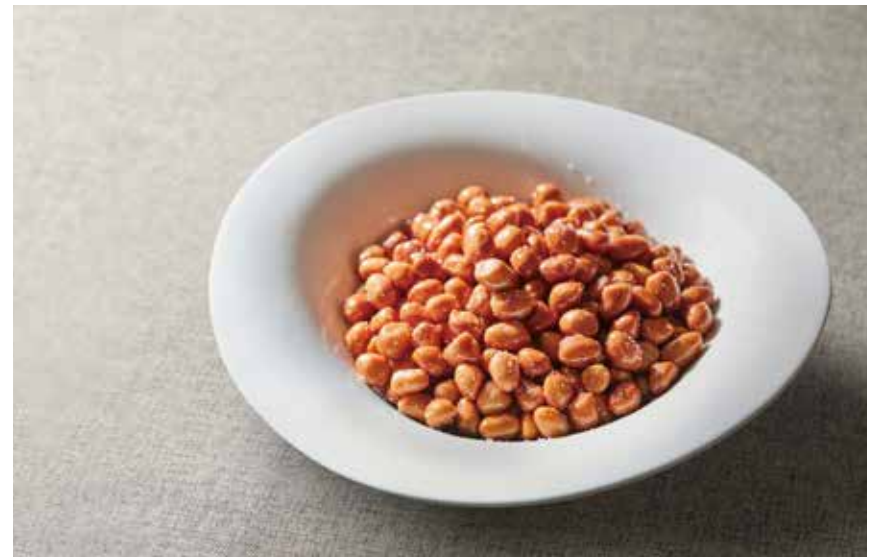
椒盐花生米 CRUNCHY SALT AND PEPPER PEANUTS