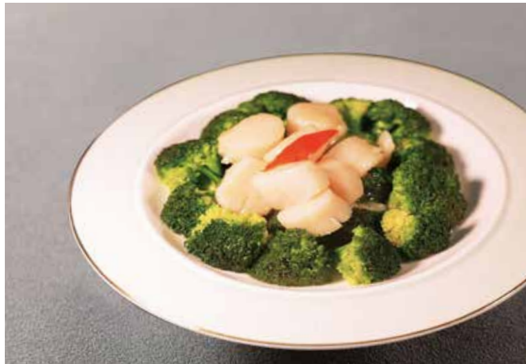
西兰花澳带 PAN-SEARED SCALLOPS WITH TENDER BROCCOLI