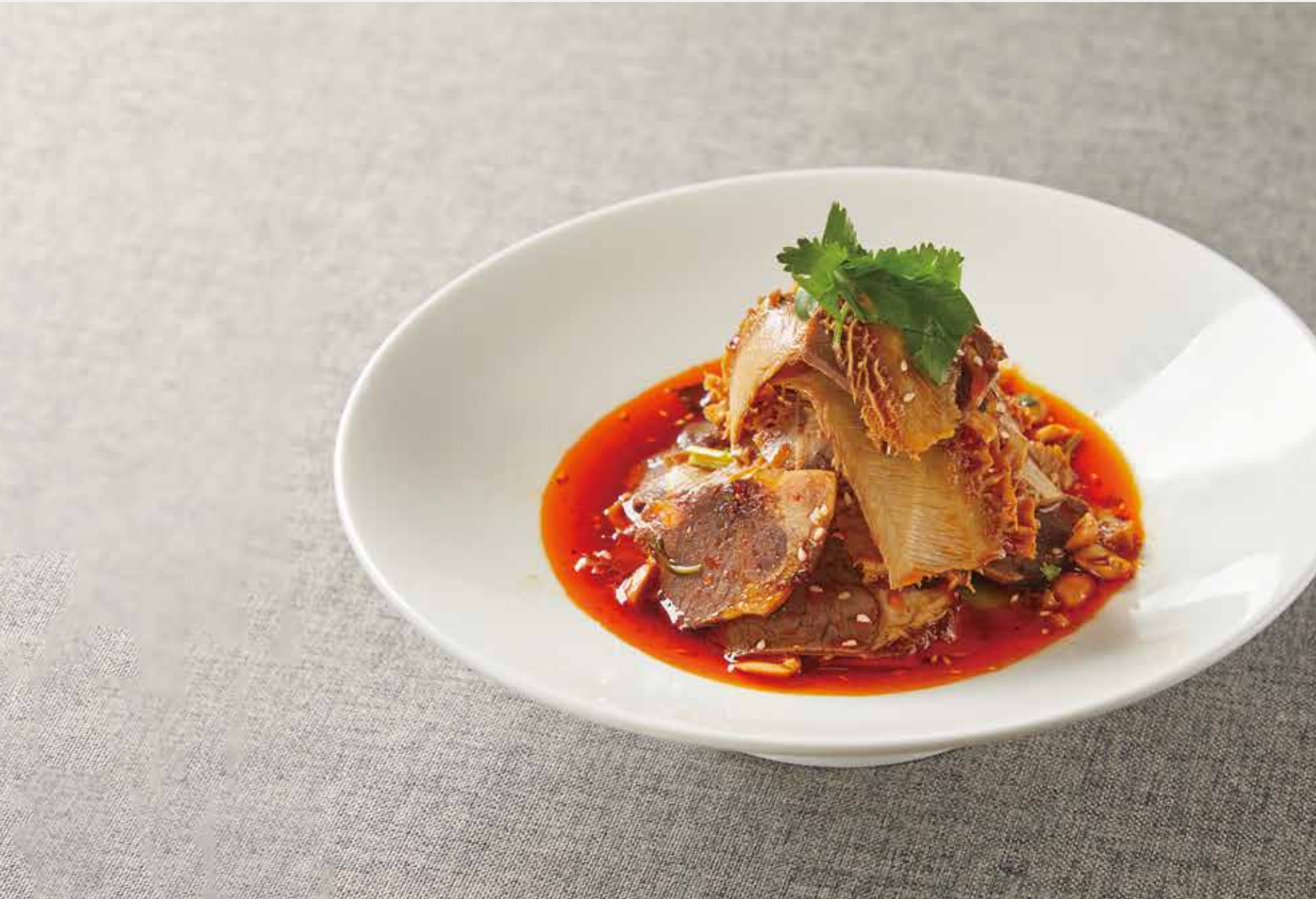
新派夫妻肺片 SPICY SLICED BEEF AND OX TRIPE