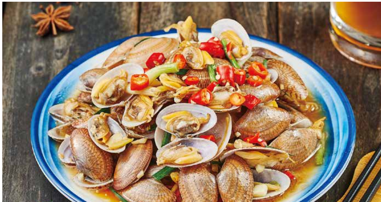
麻辣贡贡 (辣味炒制) MALA JUMPING SPICY GONG GONG CLAMS