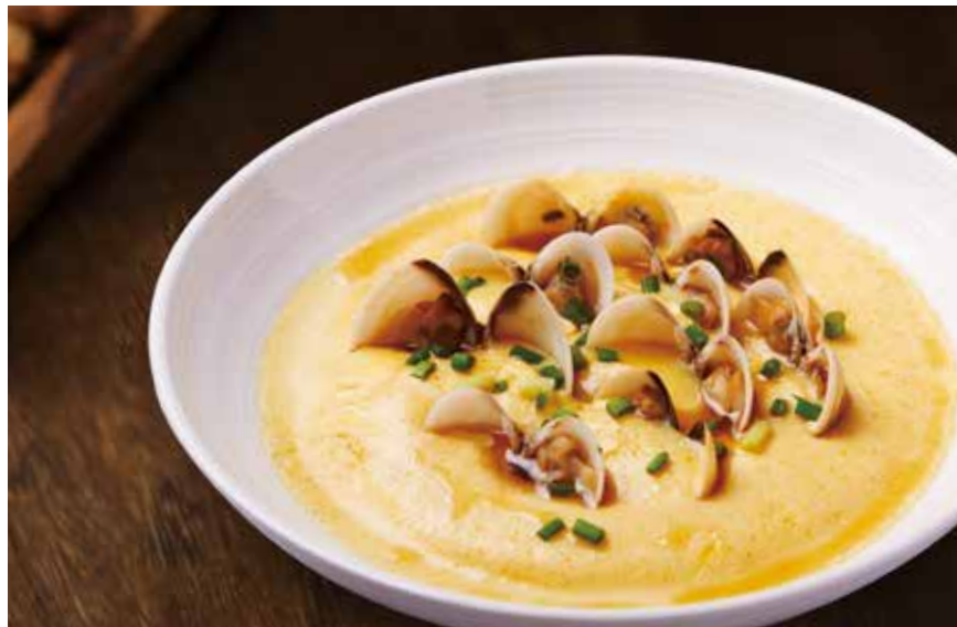
鲜贝壳蒸水蛋 STEAMED EGG WITH FRESH CLAMS