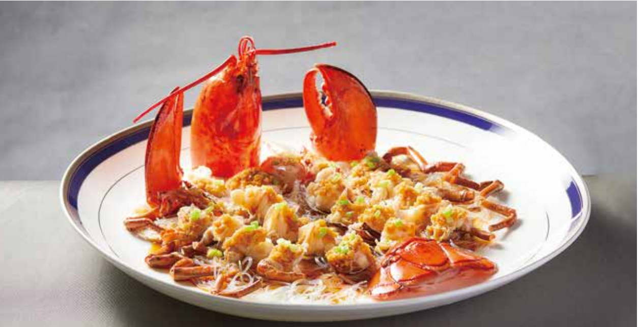
澳龙 ( 刺身 | 椒盐 | 咸蛋黄 ) AUSTRALIAN LOBSTER