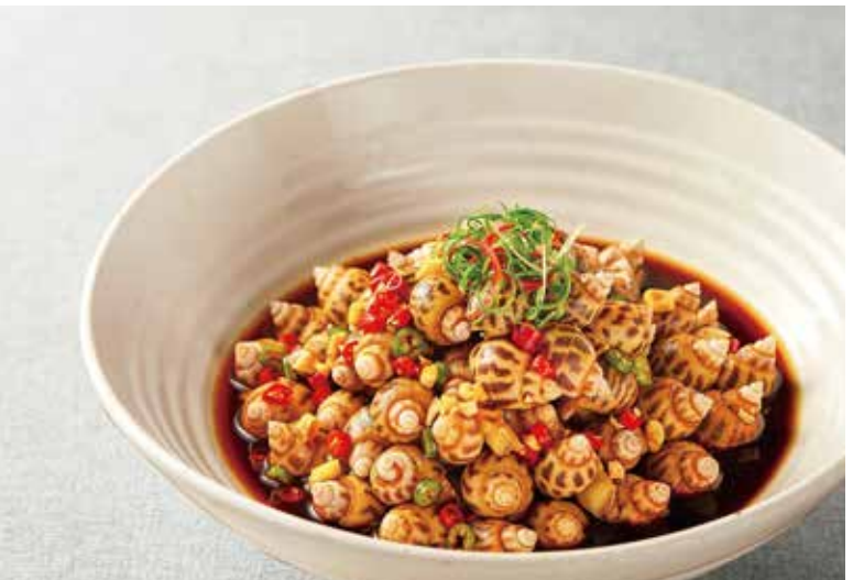
捞汁花螺 HERBAL WOOD EAR MUSHROOMS