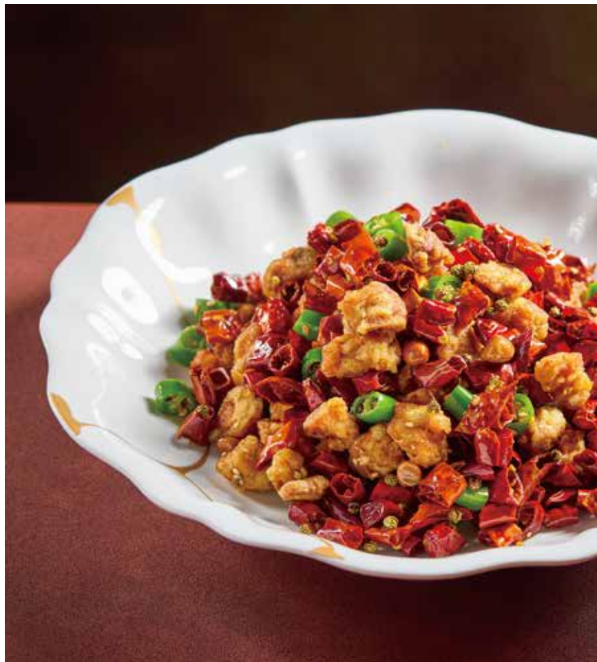
砂姜鸡 BRAISED GINGER CHICKEN