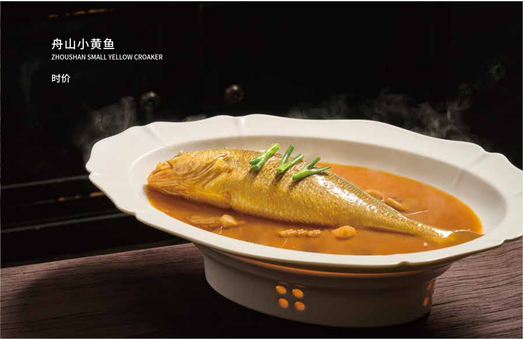
舟山小黄鱼 ZHOUZHAN SMALL YELLOW CROAKER 时价