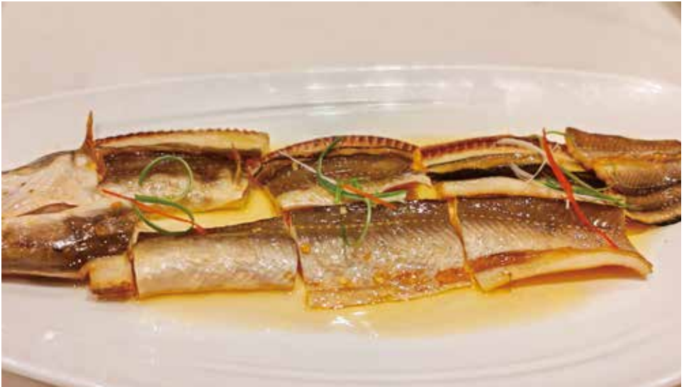
宁波舟山鳗鱼 NINGBO-ZHOUSHAN EEL