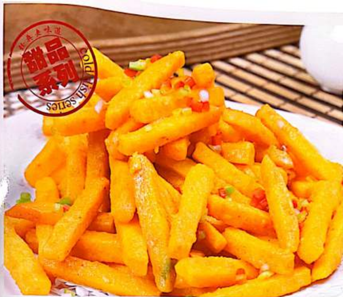
150 蛋黄焗南瓜 $ 12 Pumpkin With Salted Egg Yolk