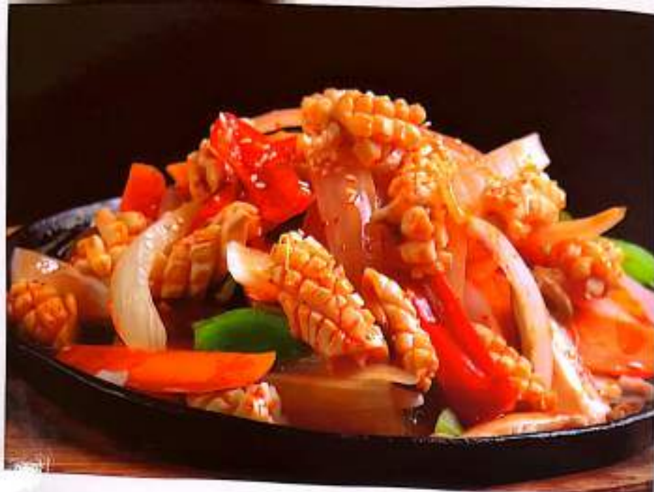
115 铁板鱿鱼 Squid On Hot Plate

HOW MANY WORRIES CAN THERE BE IN LIFE TASTE ALL THE GOOD FOOD