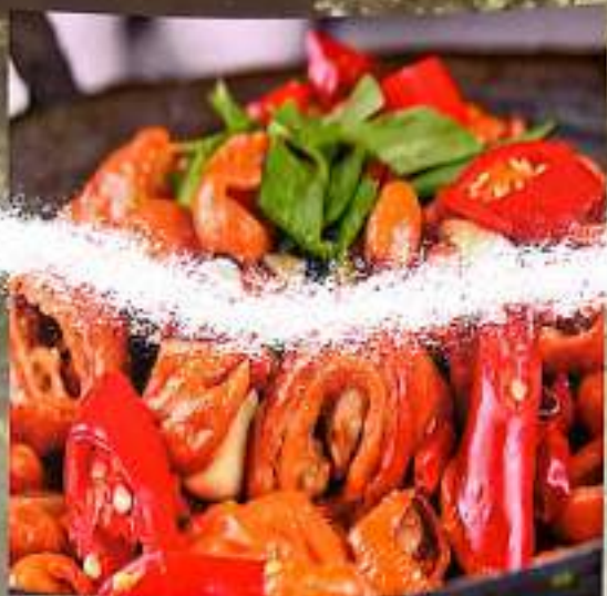
51 干锅肥肠 $ 18 Griddled Pig Intestines