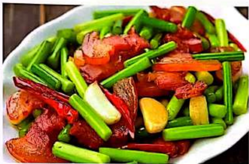
94 蒜苔腊肉 $ 16 Garlic Shoots With Bacon