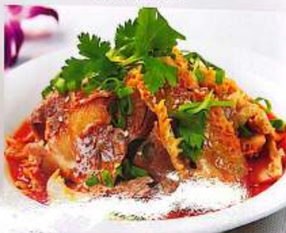
27 夫妻肺片 $ 12 Sliced Beef And Ox Tongue In Chili Sauce