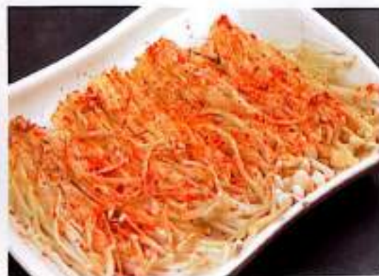
248 烤金针菇 $ 3 Grilled Enoki Mushrooms