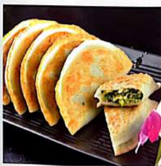
197 韭菜盒子 Leek Pancake $ 5 (2个)