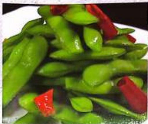
34 糖醋蚕豆 Sugar Peas in Brine $ 6