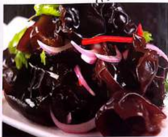
28 凉拌木耳 (辣根) $ 7 Black Fungus Salad (or With Wasabi)