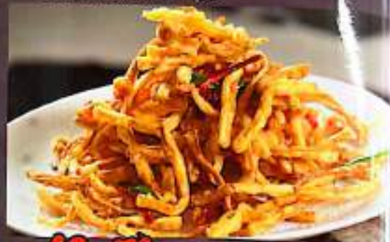
69 70 干炸 (干煸) 鲍杏菇 $ 12 Deep Fried King Oyster Mushrooms Stir-Fried King Oyster Mushrooms