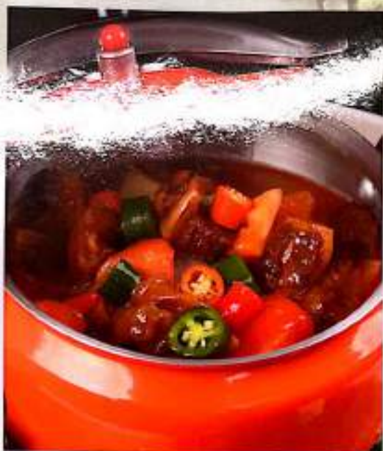
53 压锅牛肉 (压锅猪蹄) $ 20 Pressure Cooker-Beef Pressure Cooker-Trotter