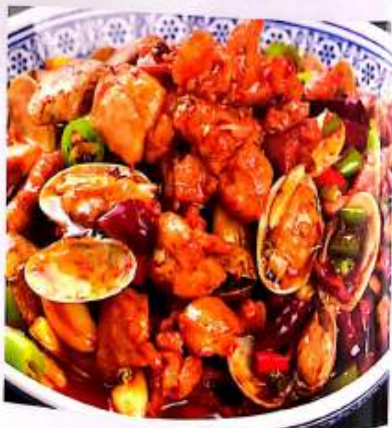
130 花甲鸡 $ 18 Spicy Clam Chicken

HOW MANY WORRIES CAN THERE BE IN LIFE TASTE ALL THE GOOD FOOD 人生能有几多愁 美食尝遍消尽愁