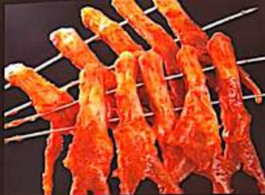
222 烤鸭舌 $ 5/6 Grilled Ducks'tongue