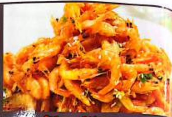
67 68 干炸小虾 (干炸小鱼) $ 12 Deep Fried Shrimps