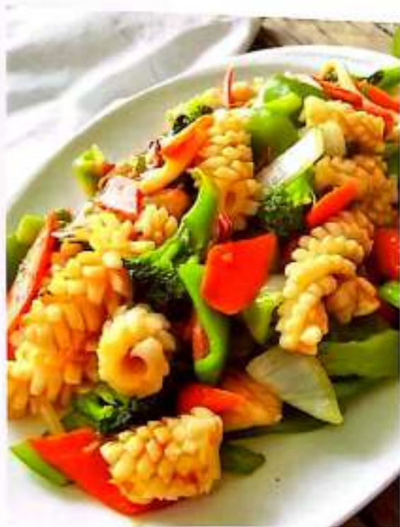
116 双椒鱿鱼 $ 18 Squid With Peppers