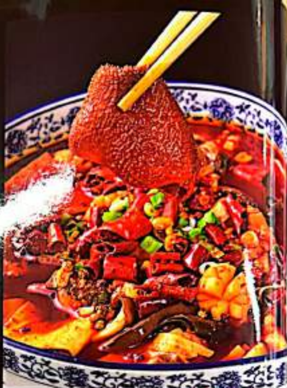
58 川味四宝 Four Treasures Of Sichian