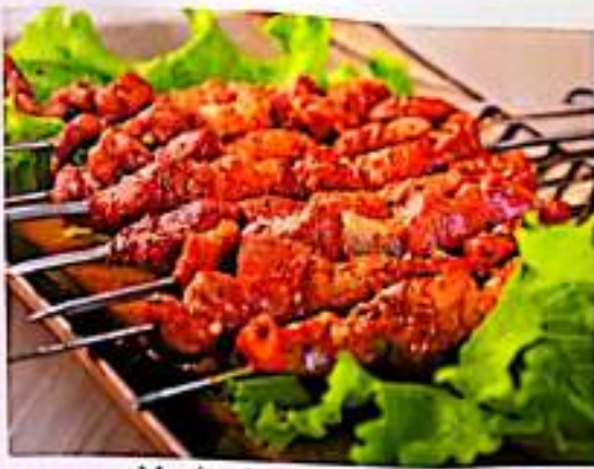
214 羊肉串 $ 1 Mutton Skewer