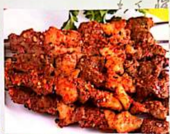
215 烤牛肉串 $ 1 Beef Skewer