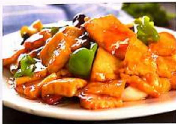
156 家常豆腐 $ 10 Home - Style Tofu