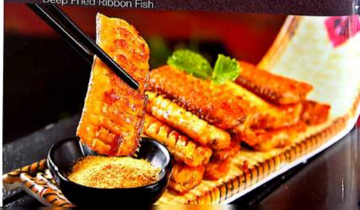
71 干炸带鱼 $ 13 Deep Fried Ribbon Fish