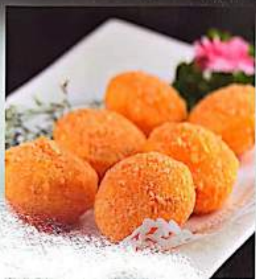
194 南瓜饼 Pumpkin Fritters