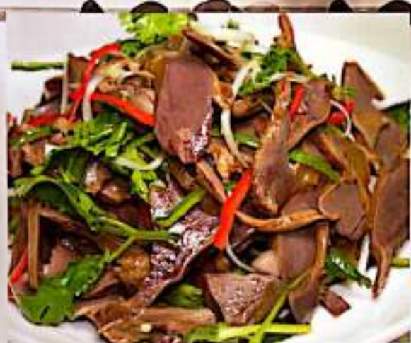
31 凉拌鸡胗 $ 10 Chicked Gizzard Salad