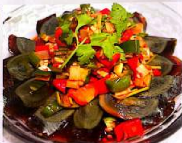
青椒皮蛋 18 $ 9 Preserved Century Egg With Gree Pepper