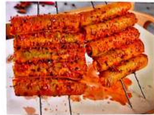
249 烤豆皮菜卷 $ 2/串 Grilled Tofu Skin