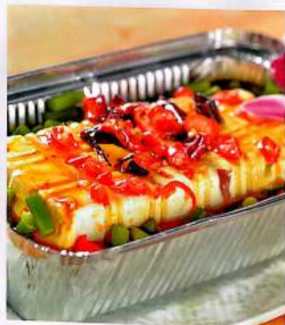
255 锡纸豆腐 $ 5/份 Grilled ToFu in Tinfoil