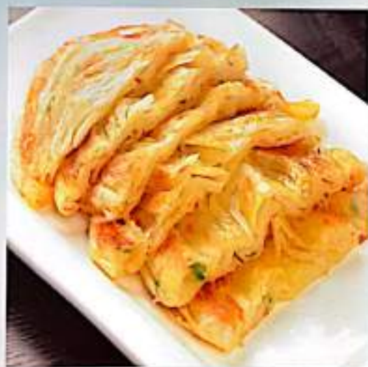
196 葱油饼 Scallion Pancakes $ 4 (2个)