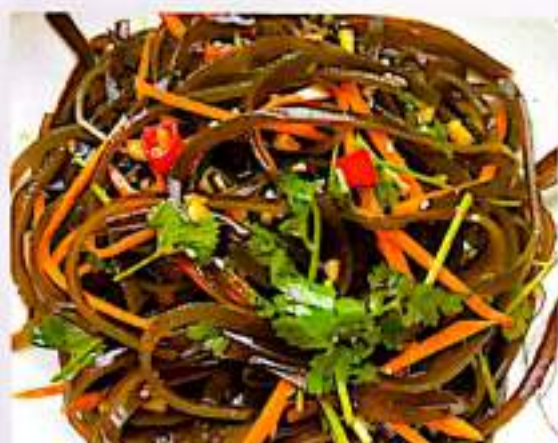
41 凉拌海带丝 $ 6 Seaweed Strips Salad