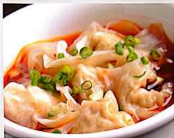
190 红油抄手 $ 7 Wonton In Chili Soup