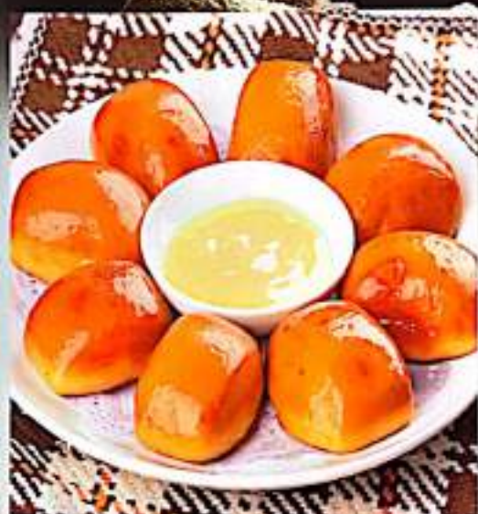
$ 8 /10个 195 炸小馒头 $ $10/10个 Fried Mini Buns