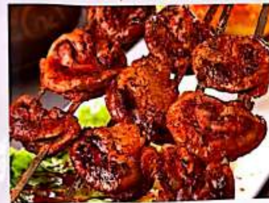
218 烤羊腰 $ 5 Lamb Kidney Skewer