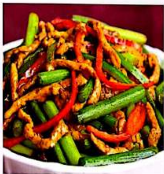
96 蒜苔肉丝 $ 12 Shredded Pork With Garlic Shoot