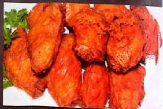
68 虾酱鸡翅 $ 13 Shrimp Paste Chicken Wings