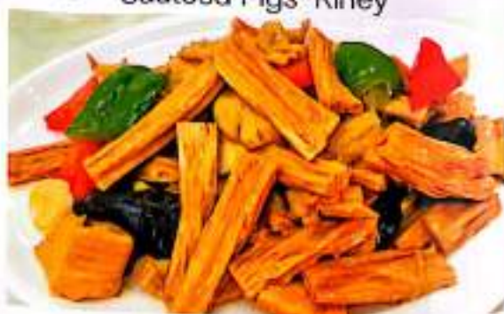
78 腐竹炒肉 $ 10