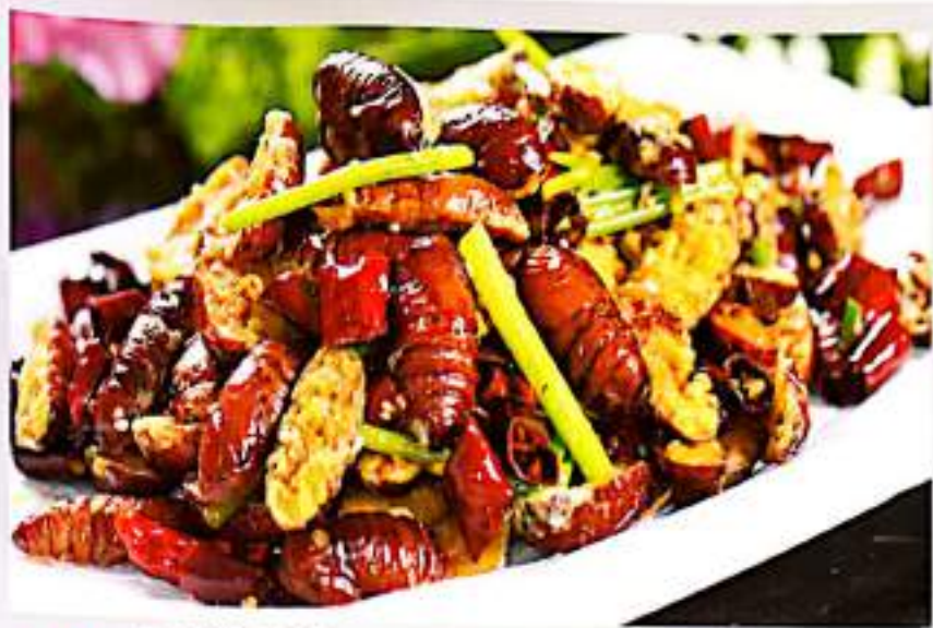
93 干煸蚕蛹 $ 16 Sauteed Silkworm Chrysalis