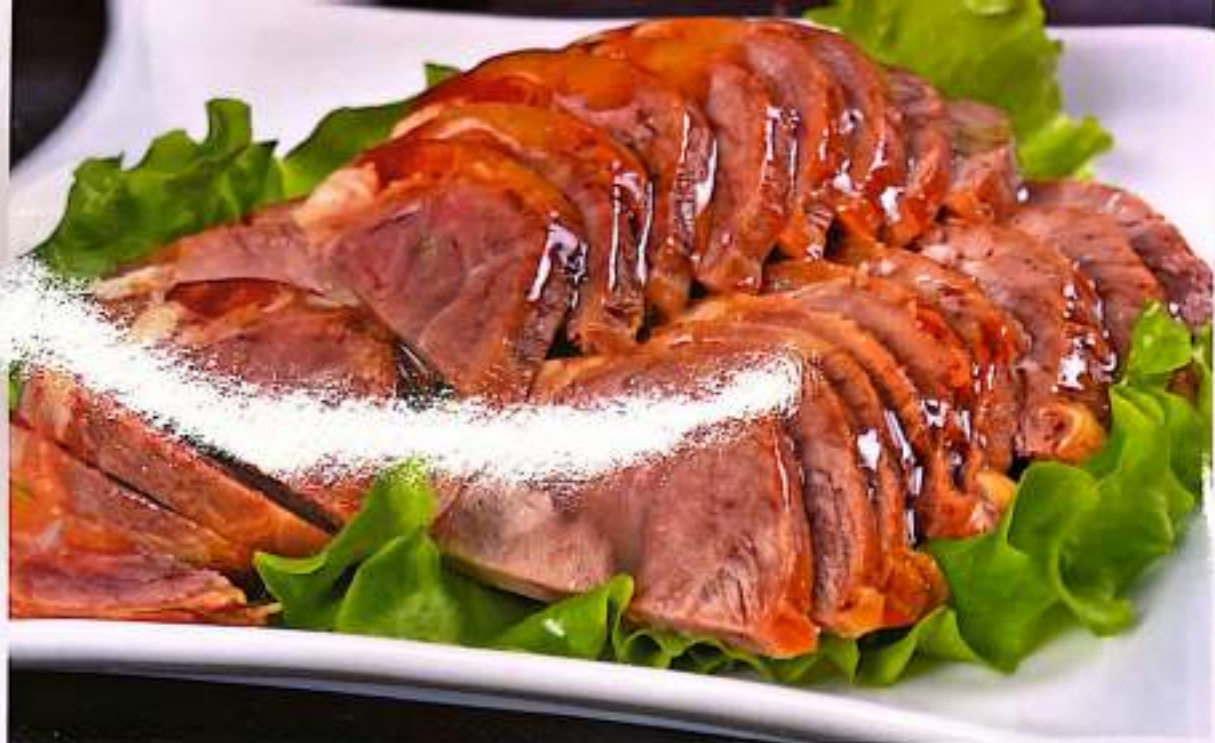
16 酱牛肉 Braised Beef