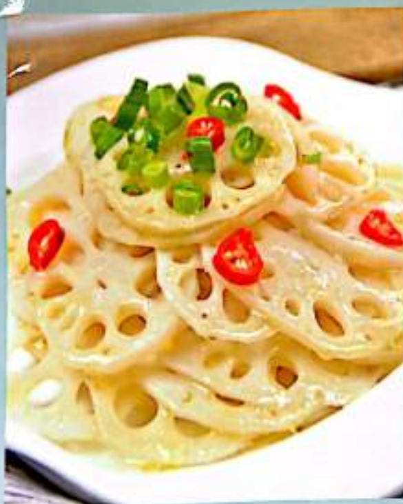
爽口脆藕 14 $ 8 Crunchy Lotus Root