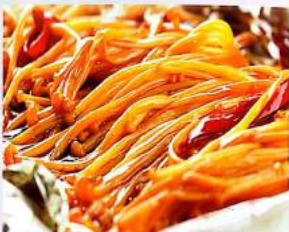
252 锡纸金针菇 $ 8 Grilled Enoki Mushroom in Tinfoil