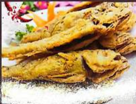
65 干炸黄花鱼 $ 13 Deep Fried Yellow Croaker