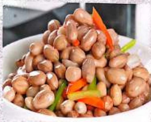
36 盐水花生 (油炸) Peanuts In Brine (Fried) $ 6