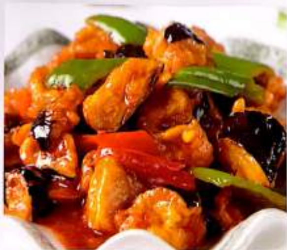
166 红烧茄子 $9 Braised Eggplant