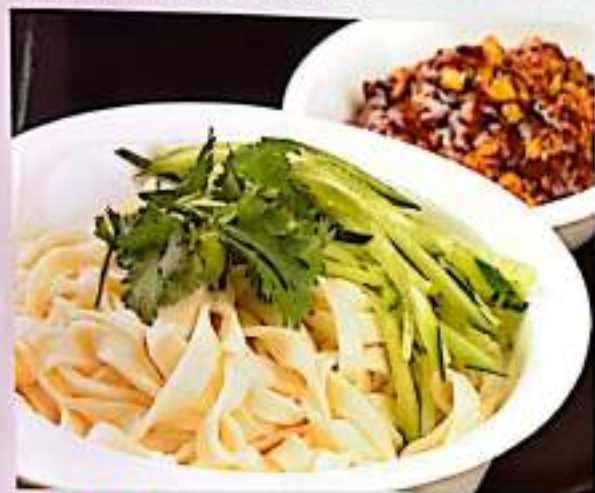
191 炸酱面 $ 6 Minced Pork Noodles