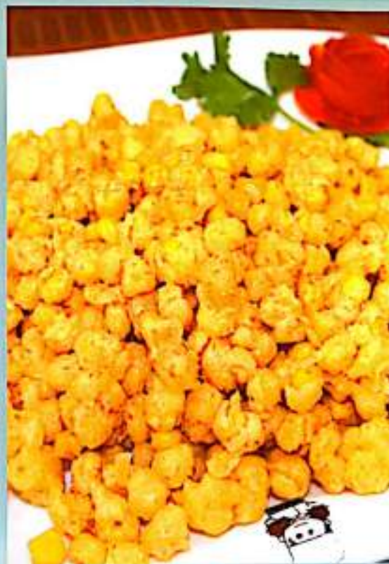
152 黄金玉米粒 $ 12 Golden Corn Kernels