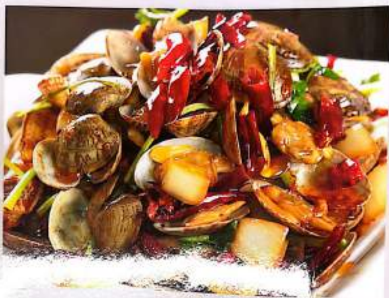
128 辣炒花蛤 $ 13 Spicy Clams