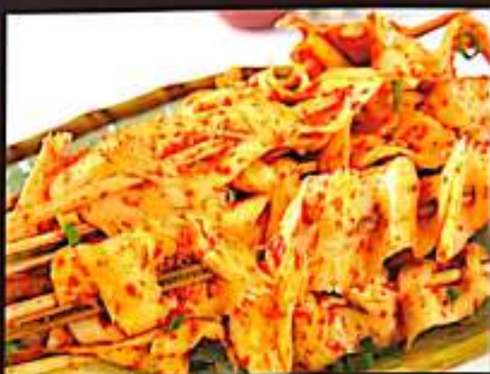
224 牛板筋 $ 1.5 Grilled Beef Tendon