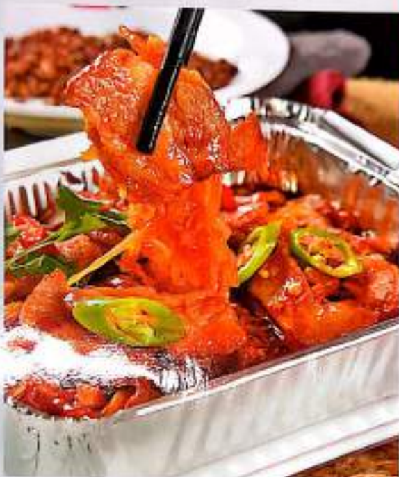
253 锡纸酸菜五花肉 $ 7 Pork Belly And Pickled Veggies In Tinfoil