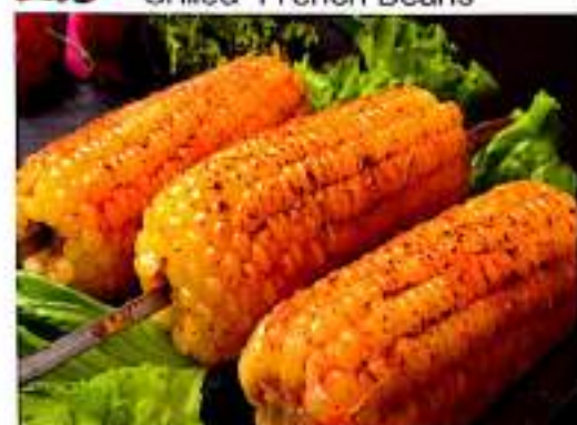
247 烤玉米 $ 1.5/串 Grilled Corn