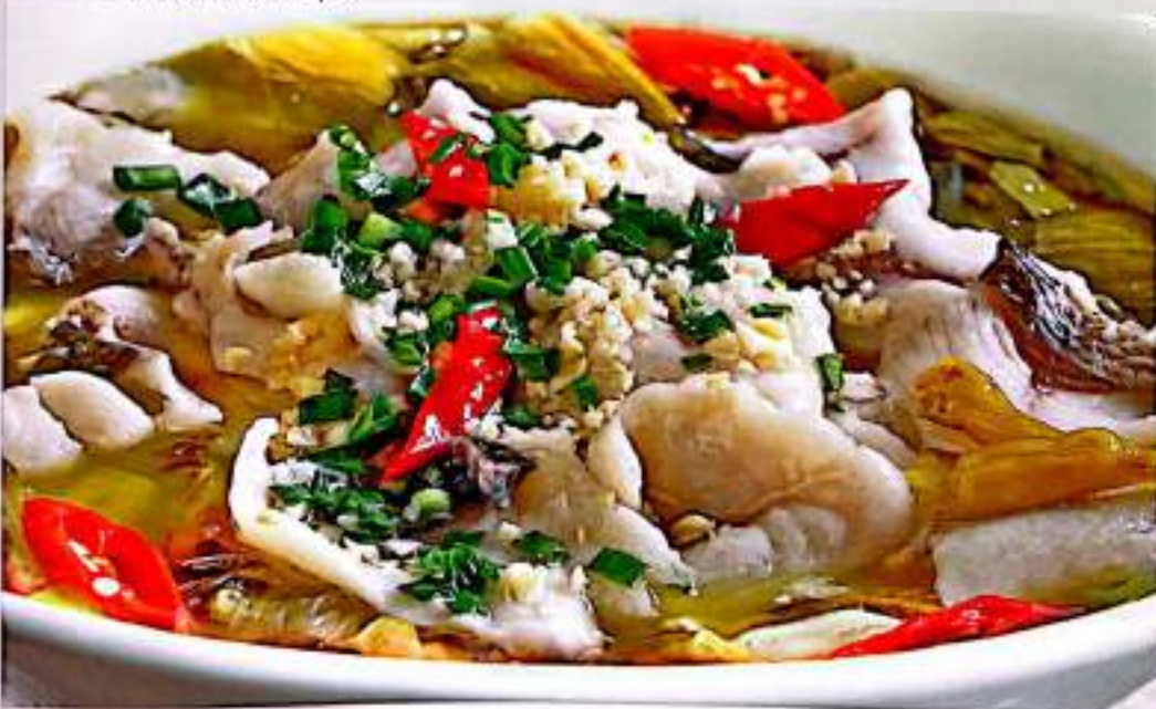
62 老坛酸菜鱼 整条 $ 26 (片) Sliced Fish In Sour Soup (整条) Whole Fish In Sour Soup