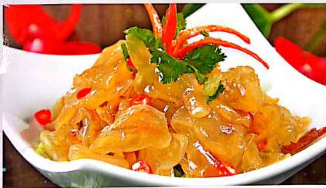
43 捞拌海蜇 $ 13 Jellyfish Salad