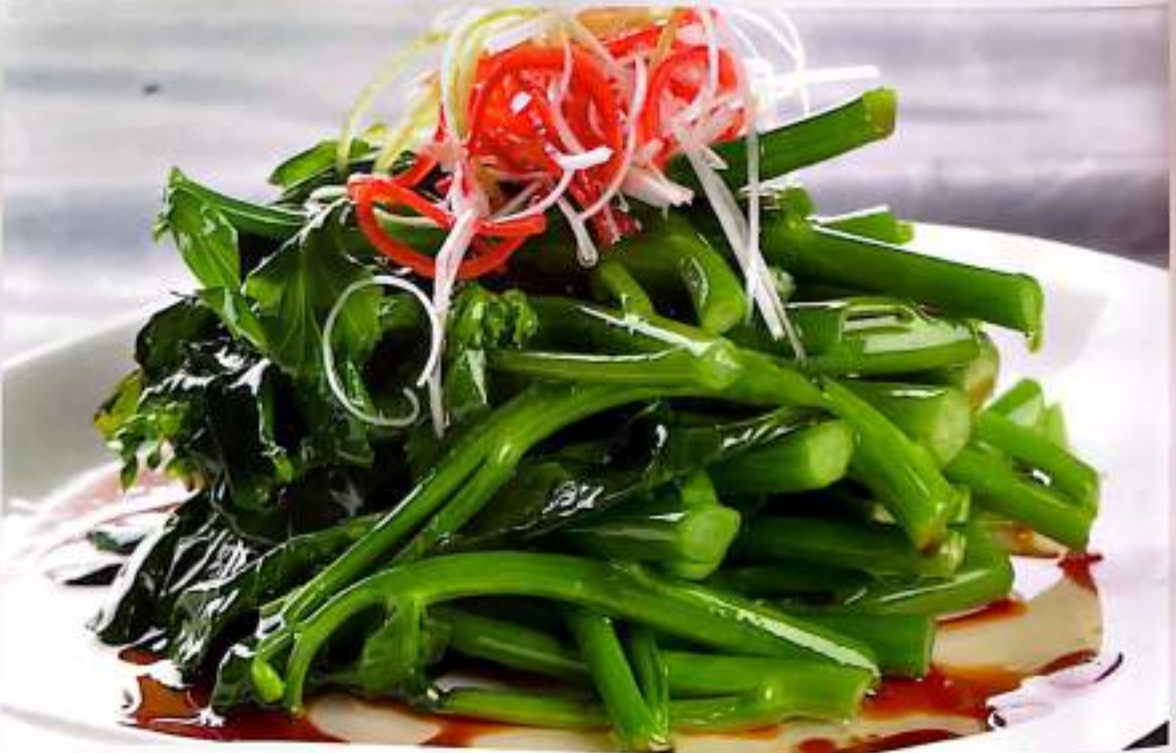
179 白灼芥兰 Boiled Kale