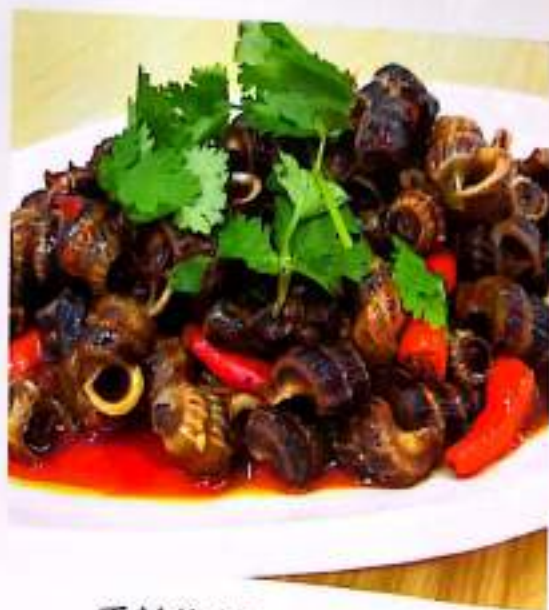
129 香辣海螺 $ 13 Spicy Conch