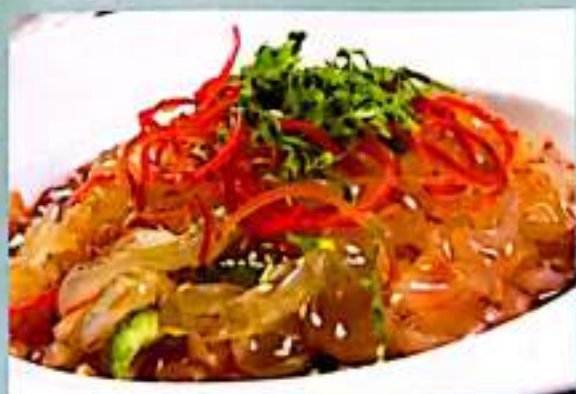
东北大拉皮 15 $ 8 Sour-spicy Sweet Potato Noodles