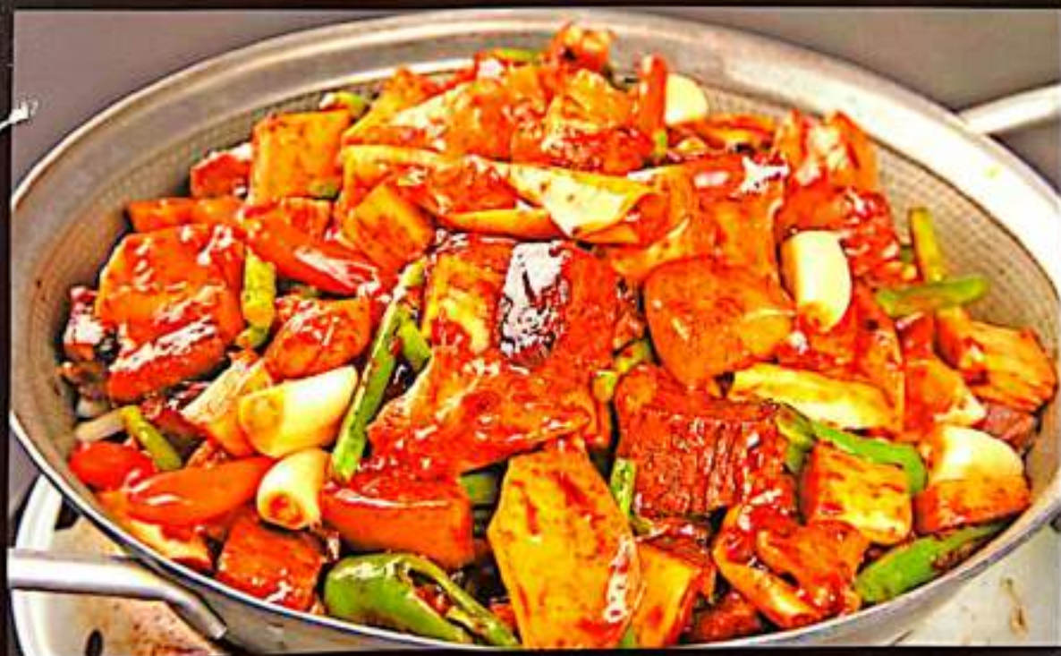
50 筋头巴脑 $ 18 Griddled Beef Tendon