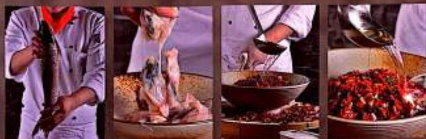
56 水煮鱼片 $ 15 Poached Fillet