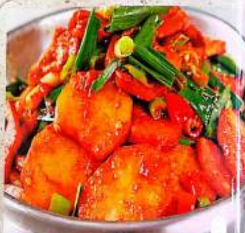
46 干锅土豆片 $ 12 Griddled Sliced Potato