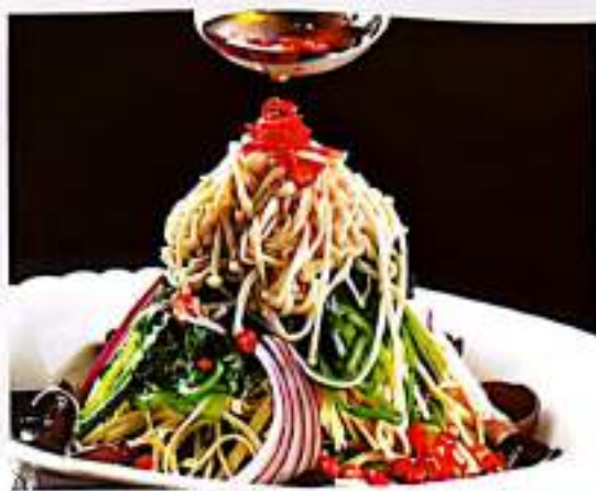
39 捞汁什锦 $ 10 Mixed Vegetable Salad