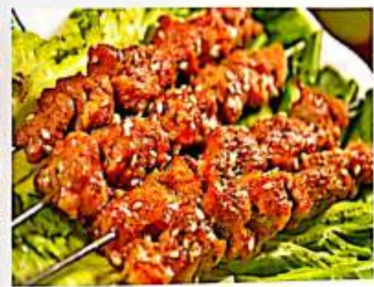
217 五花肉 $ 1 Pork Belly Skewer