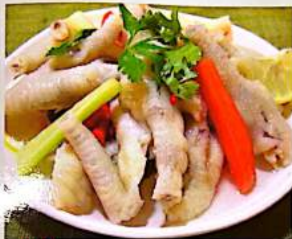
21 泡椒凤爪 $ 9 Chicken Feet With Pickled Pepper