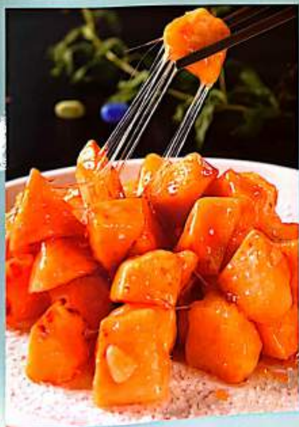
151 拔丝地瓜 $ 12 Candied Sweet Potato