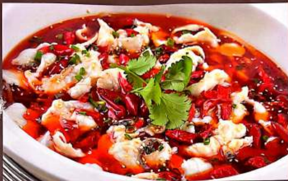
55 招牌豆花鱼 $ 18 Sightured Sliced Fish With Tofu