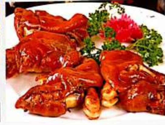
219 猪蹄 $ 6 Pig's Trotters