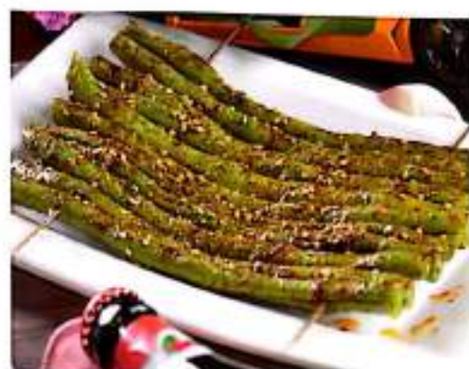
245 烤四季豆 $ 1 Grilled French Beans