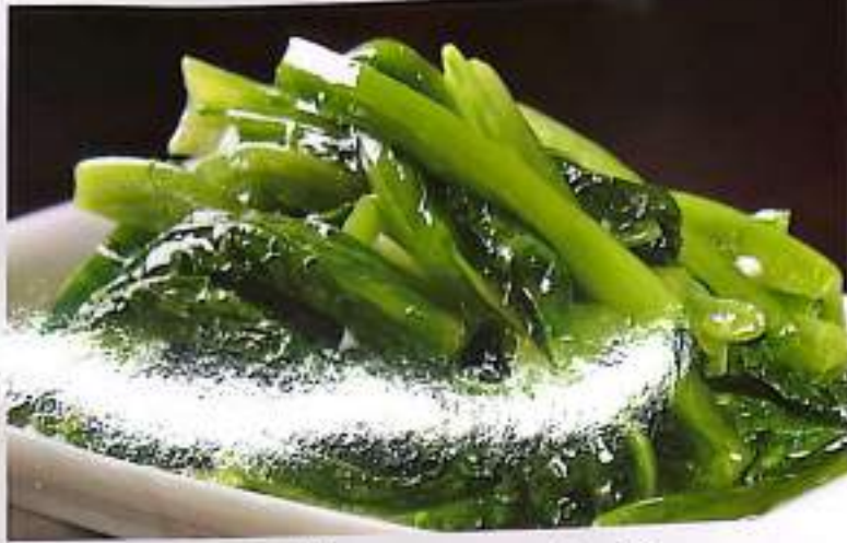
175 油麦菜 Lettuce