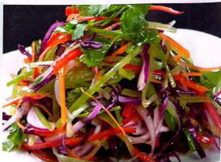
29 家常小凉菜 $ 8 Home Cooked Salad