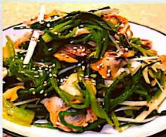
22 菠菜拌毛蛤 $ 12 Spinach With Cockles