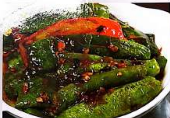
153 虎皮尖椒 $ 10 Sautéed Green Peppers