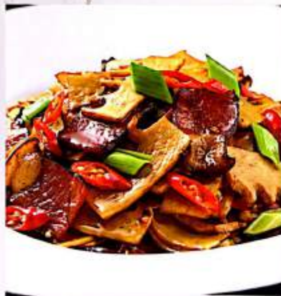
95 湘味腊肉 $ 18 Hu-nan Style Bacon