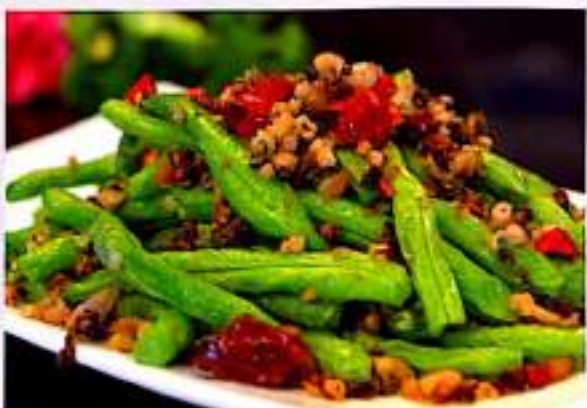
158 干煸四季豆 $ 10 Sautéed French Beans