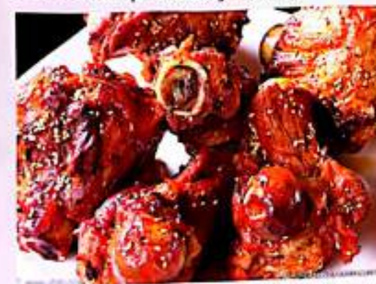
220 碳烤大骨头 $ 5/个 Charcoal Grilled Pig Bone