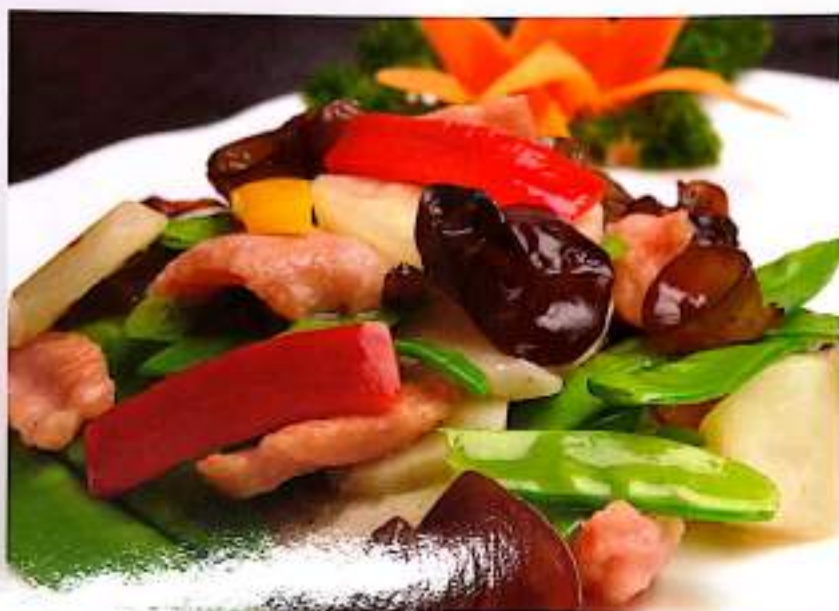
165 健康小炒 $12 Home-style Mixed Veggies