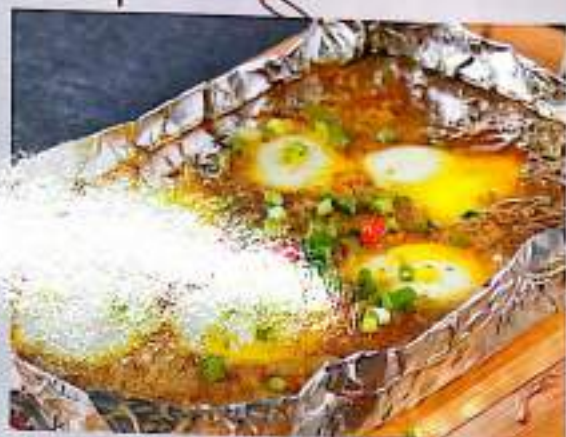
250 锡纸卧蛋 $ 3 Grilled Eggs In Tinfoil