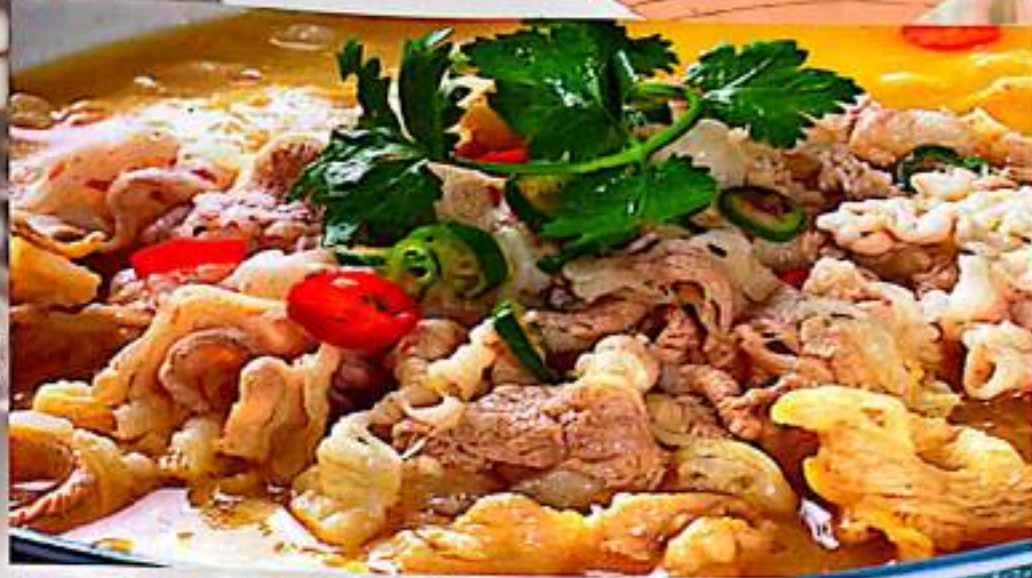
60 酸汤肥牛 $ 17 Beef In Sour And Spicy Soup