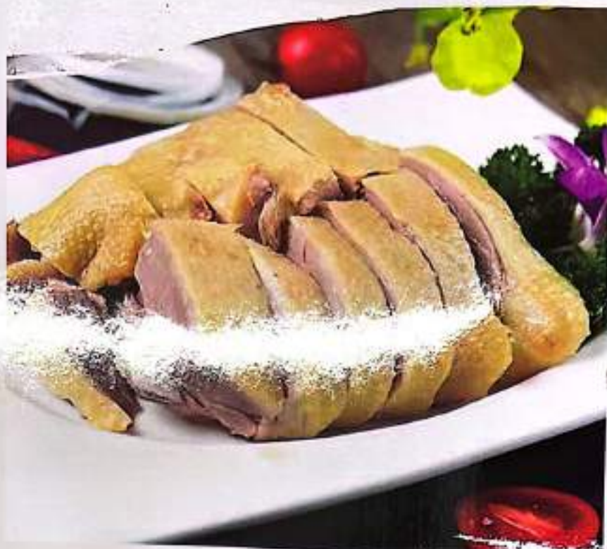
26 盐水鸭 $ 14 Duck In Brine