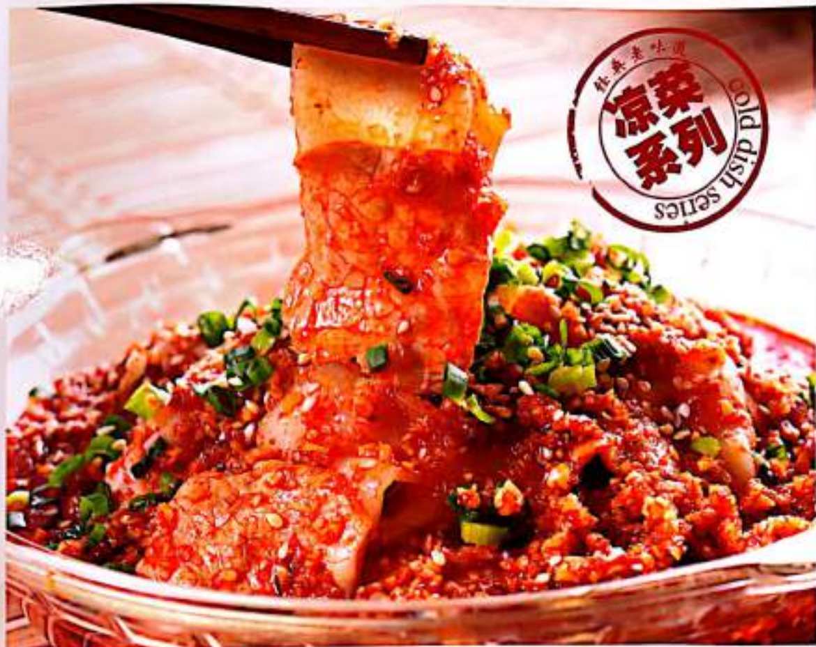
蒜泥白肉 12 $ 10 Sliced Boiled Pork Belly With Minced Garlic