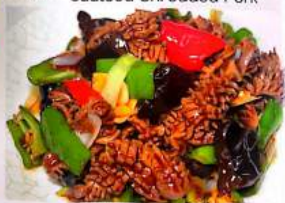
76 爆炒腰花 $ 12 Sauteed Pigs' Kinney