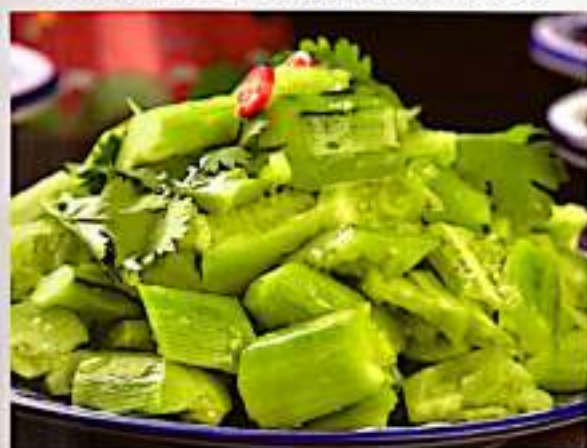
23 拍黄瓜 $ 6 Cucumber Salad