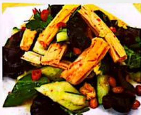
40 凉拌腐竹 $ 8 Bean Curd Salad