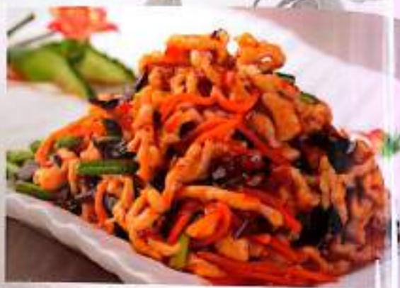
75 鱼香肉丝 $ 12 Sauteed Shredded Pork