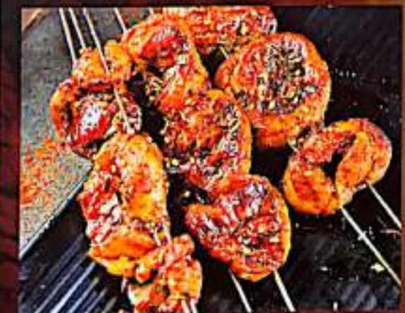
227 烤肥肠 $ 1.5 Roast intestine