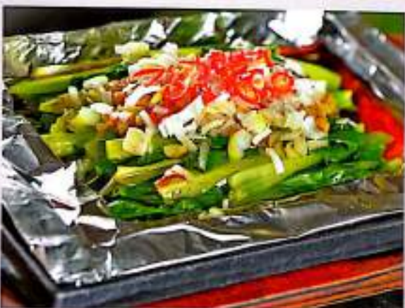
254 锡纸油麦菜 $ 6 Grilled Lettuce In Tinfoil