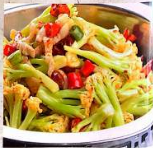
48 干锅有机菜花 $ 13 Griddled Organic Cauliflower