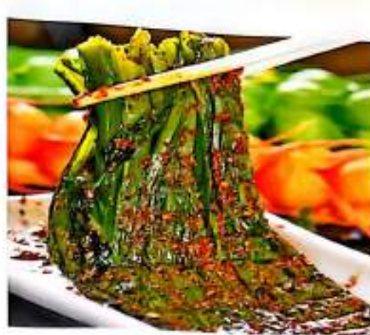
243 烤油麦菜 $ 3/份 Grilled Lettuce