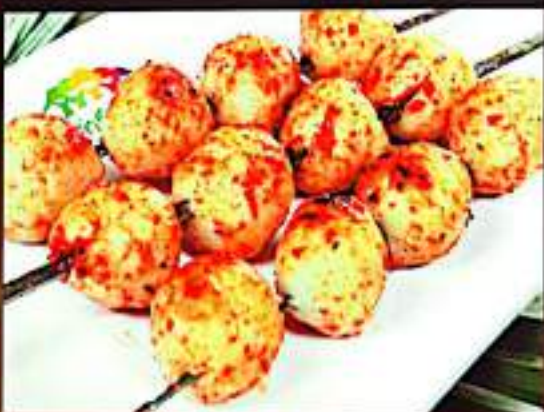
226 烤鱼丸 $ 1.5 Grilled Fish Ball