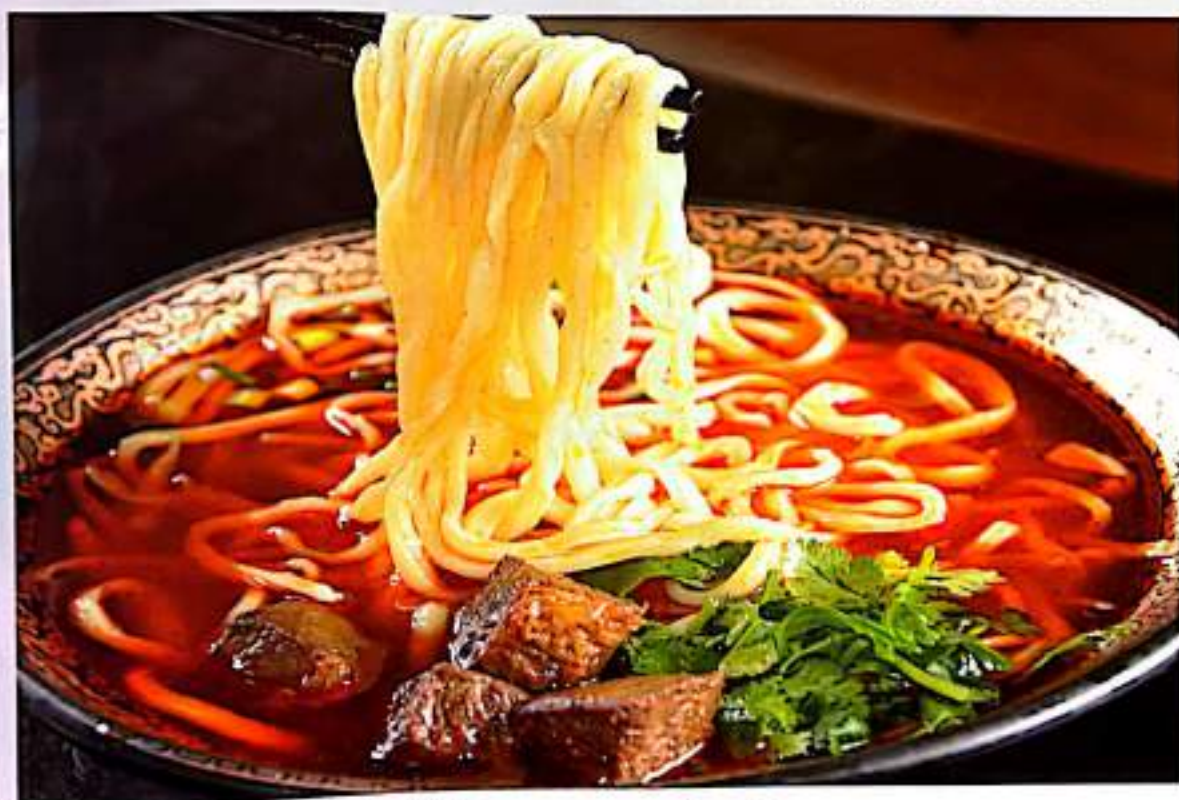
牛肉汤面 $ 7