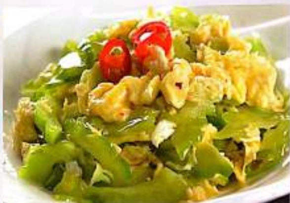
157 苦瓜炒鸡蛋 $ 10 Bitter Gourd With Egg