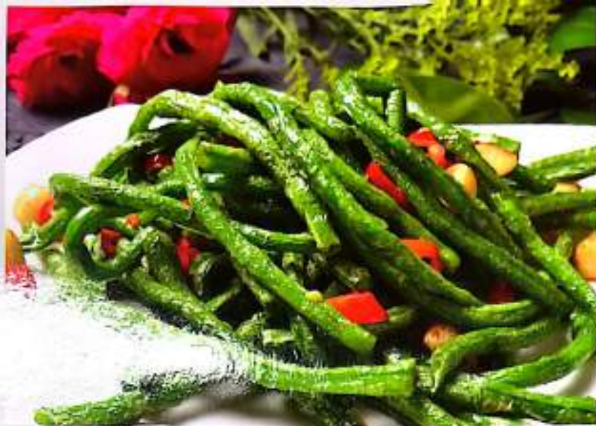
164 橄榄菜焗豆角 $9 French Beans With Preserved Kale

HOW MANY WORRIES CAN THERE BE IN LIFE TASTE ALL THE GOOD FOOD 人生能有几多愁 六食尝遍清尽愁