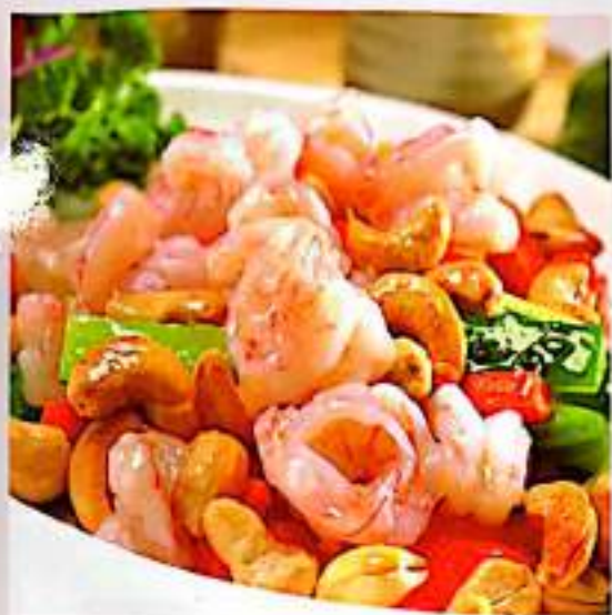
118 西芹腰果虾球 $ 18 Shrimps With Celery And Casshen Nuts