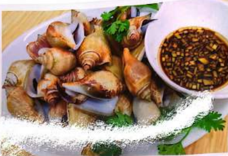
127 辣炒 (盐水) 贡贡 $ 14 Spicy Gong Gong or In Brine