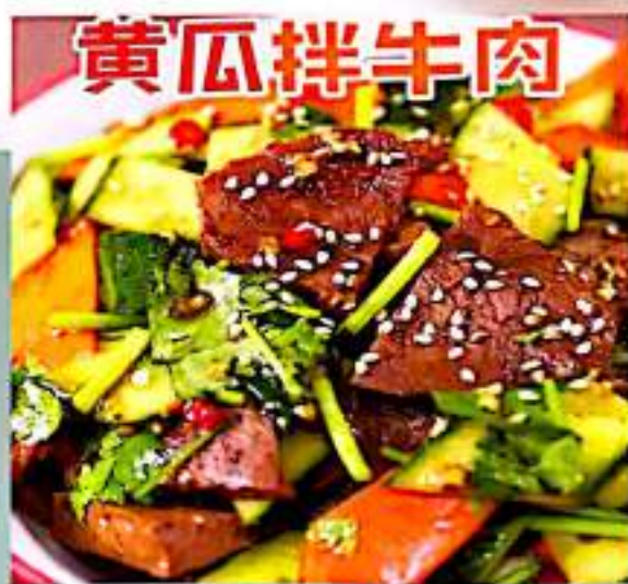
黄瓜拌牛肉 13 $ 10 Cucumber And Beef