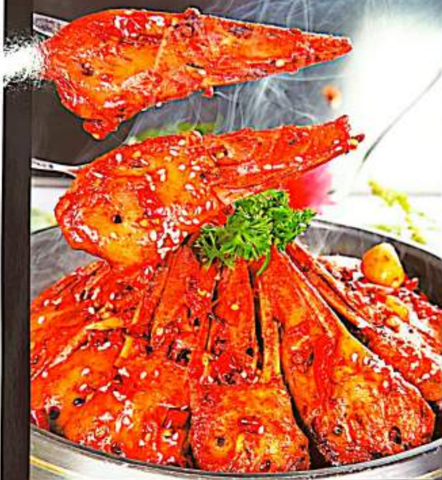
49 麻辣鸭头 $ 18 Griddled Mala Duck Head