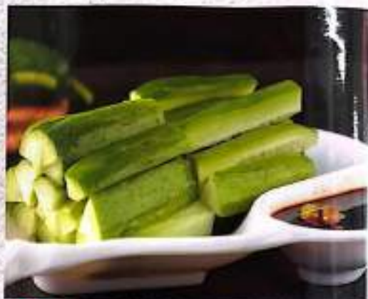
37 黄瓜蘸酱 Cucumber With Soy Bean Sauce $ 6