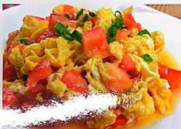
154 番茄炒蛋 $ 10 Scrambled Egg With Tomato