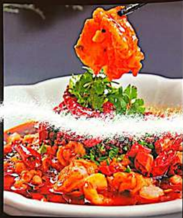
57 水煮猪肉 Poached Pork