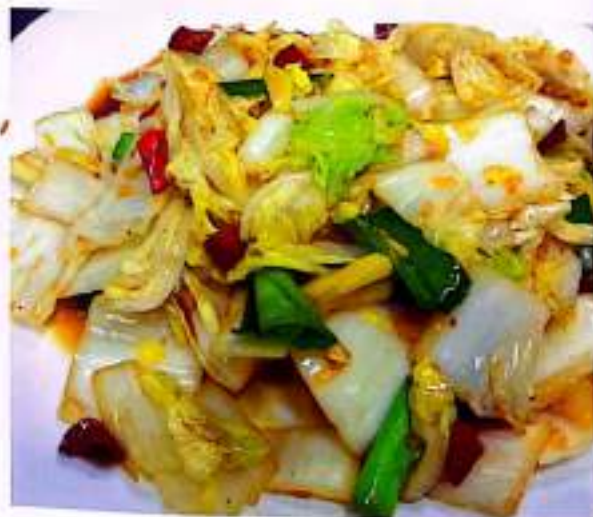
167 醋溜大白菜 $8 Cabbage With Vinegar