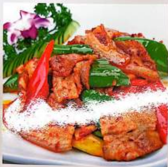
74 回锅肉 $ 13 Twice-cooked Pork