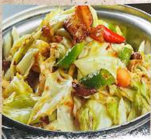
45 干锅包菜 $ 13 Griddled Cabbage