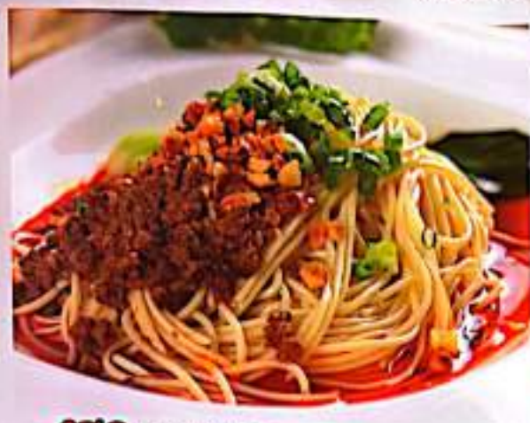
189 担担面 $ 6 SiChuan Spicy Noodle