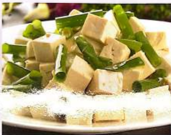
小葱拌豆腐 17 $ 6 Tofu With Spring Onion