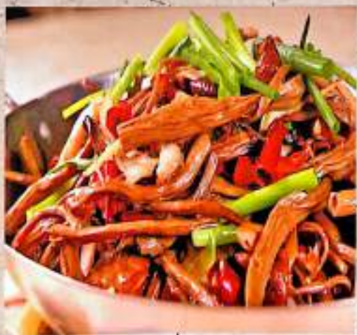
47 干锅茶树菇 $ 14 Griddled Tea Tree Mushrooms