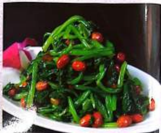
35 爽口菠菜 Spinach Salad $ 10