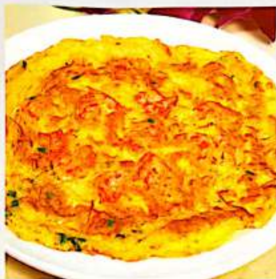
119 虾仁煎蛋 $ 12 Shrimps Omelette