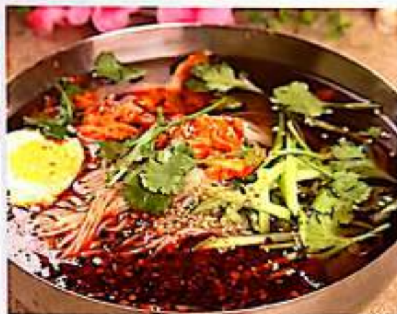
192 东北冷面 $ 7 North-eastern Style Cold Noodles