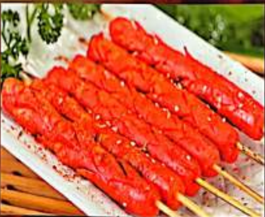
228 烤香肠 $ 2 Grilled Sausage