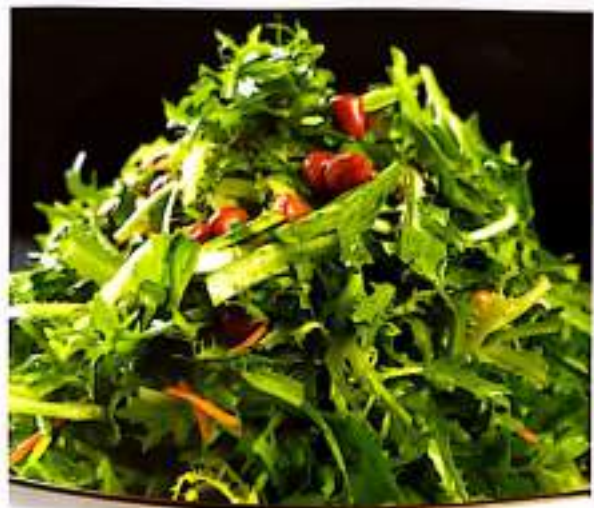
拌苦苣 19 $ 12 Endive Salad