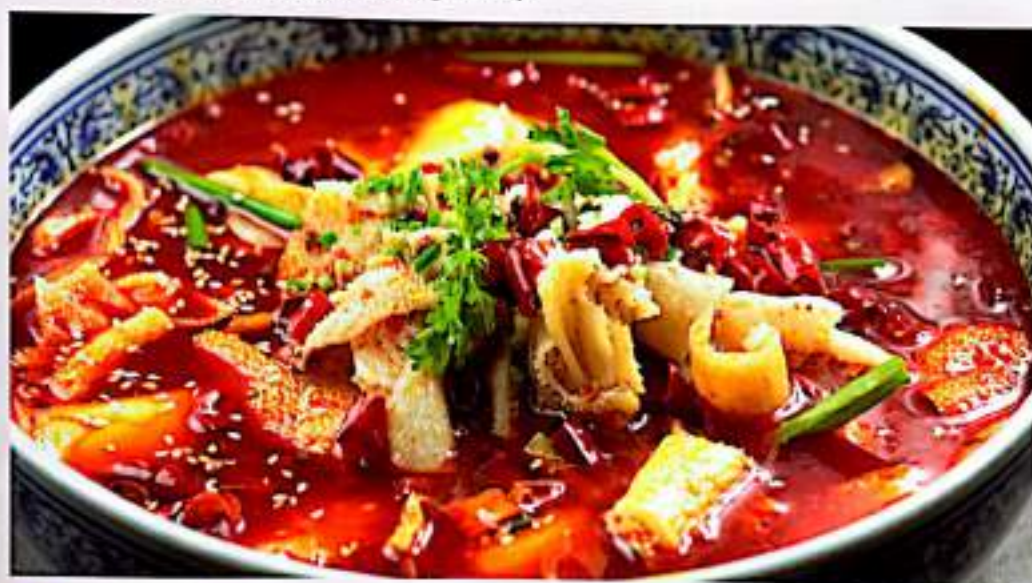
61 水煮毛肚 (肥肠) $ 18 Poached Tripe