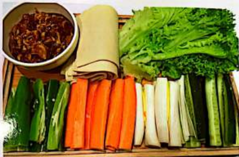
30 丰收菜 (豆腐皮 黄瓜 大葱 生菜 萝卜 青红椒) The Big Harvest $ 12