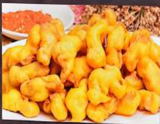
65 软炸里脊 $ 12 Soft Fried Tender Loin