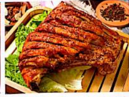
221 烤羊排 $5 (3条) Grilled Lamb Chop