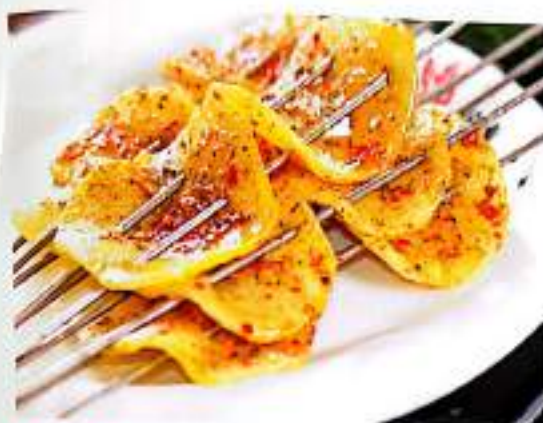
244 烤土豆片 $ 2/3串1份 Grilled Sliced Potato