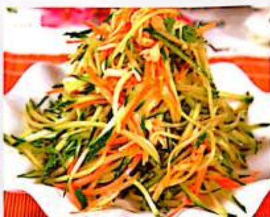
42 黄瓜金针菇 $ 8 Cucumber And Enoki Salad