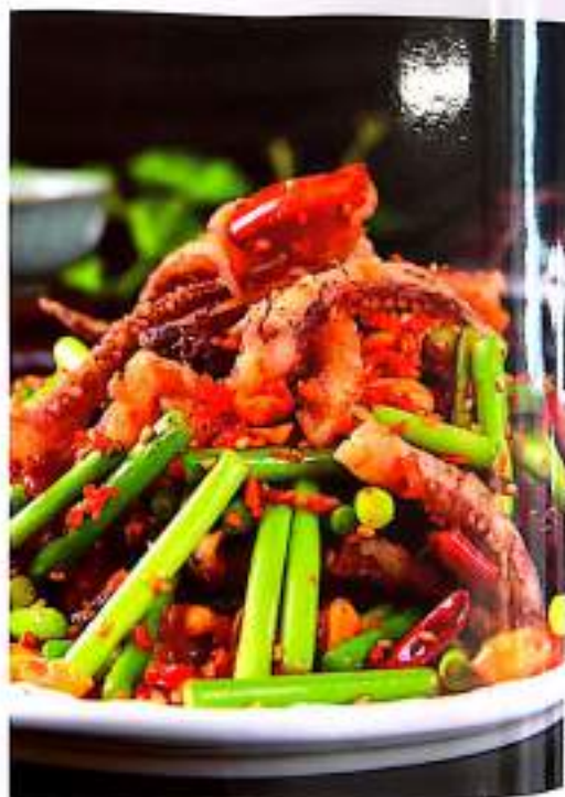
117 干煸鱿鱼 $ 18 Sauteed Squid