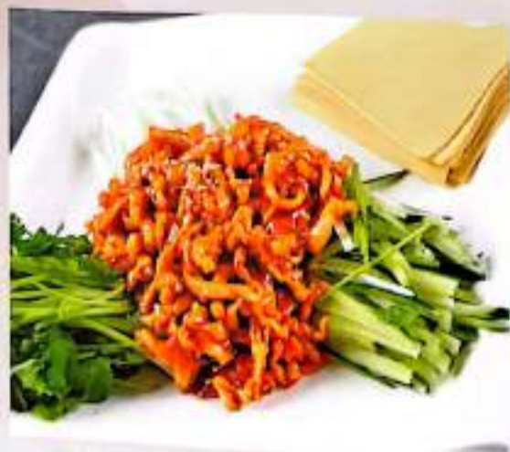
77 京酱肉丝 $ 13 Shredded Pork With D-