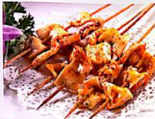
216 牛肚 $ 1.5 Beef Tripe Skewer