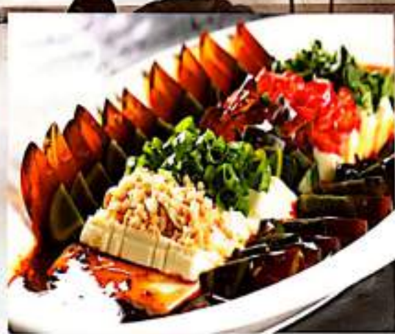
32 皮蛋豆腐 $ 8 Tofu With Preserved Century Egg