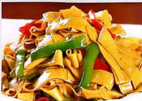
155 尖椒 (韭菜) 干豆腐 $ 9 Green Pepper (Chives) With Bean Curd