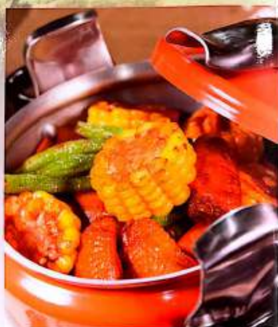
54 压锅排骨 (压锅鸡翅) $ 20 Pressure Cooker- Pork Ribs Pressure Cooker- Chicken Wings