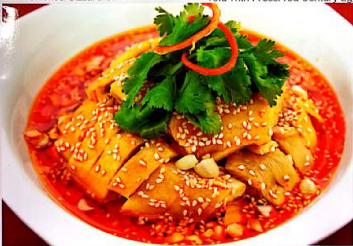
33 口水鸡 $ 12 Steamed Chicken With Chili Sauce