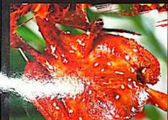
225 烤鹌鹑 $ 8 Grilled Quail