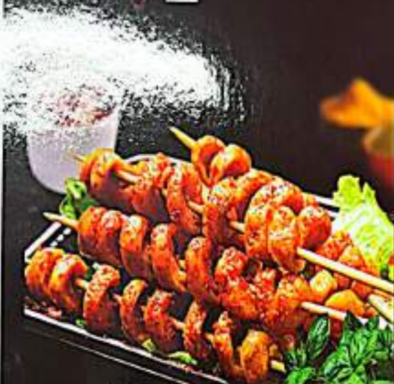
223 烤面筋 $ 2 Grilled Gluten