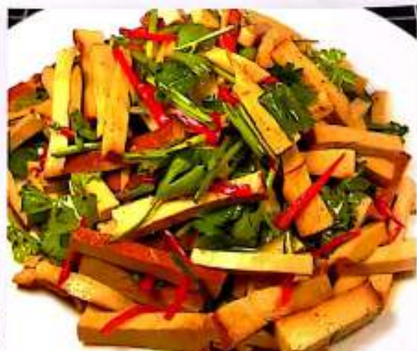
凉拌香干 20 $ 8 Dried Tofu Salad