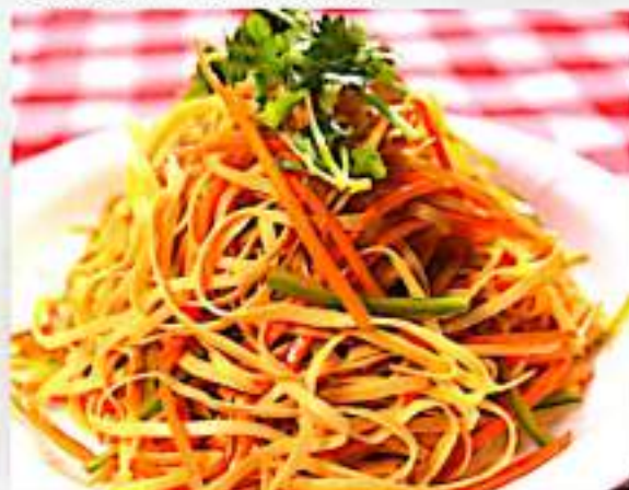
24 拌豆腐丝 $ 6 Shredded Tofu Salad