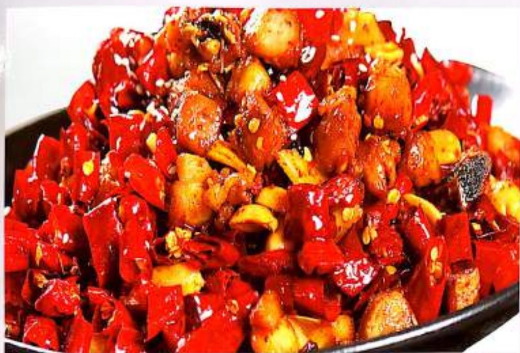
6 辣子鸡 $ 15 Sichuan Spicy Chicken