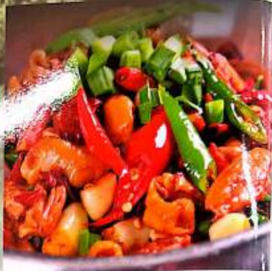
52 干锅鸡 $ 17 Griddled Chicken With Green Pepper