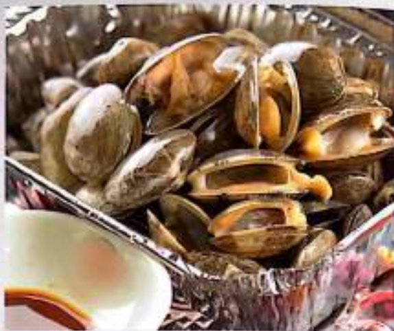
251 锡纸花蛤 $ 12 Grilled Clams In Tinfoil