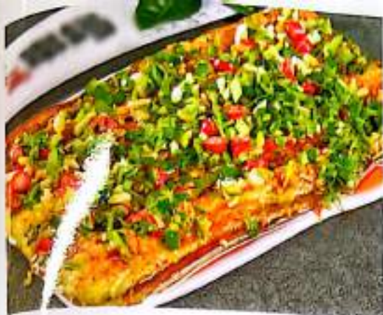
242 蒜茸烤全茄 $ 5/份 Grilled Eggplant with Garlic