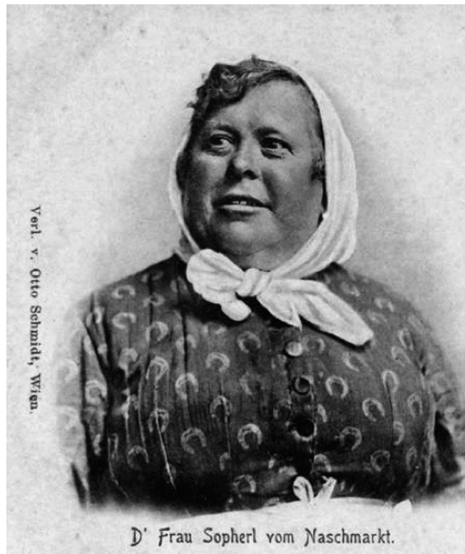
„Sopherl vom Naschmarkt“